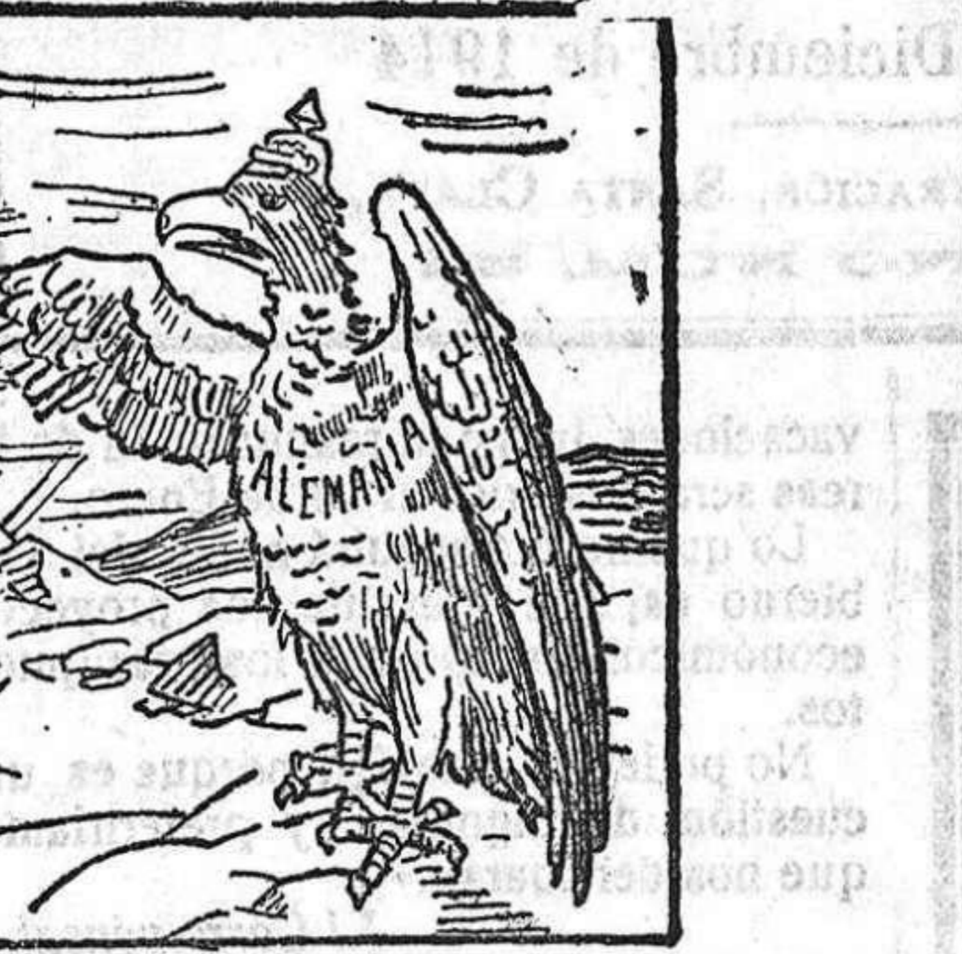
El águila prusiana.—Animo, hermana, que yo te prestaré alientos. El águila austro-húngara.—Más que alientos me hacen falta plumas. Ya ves como me ha dejado el oso y el invierno llega.