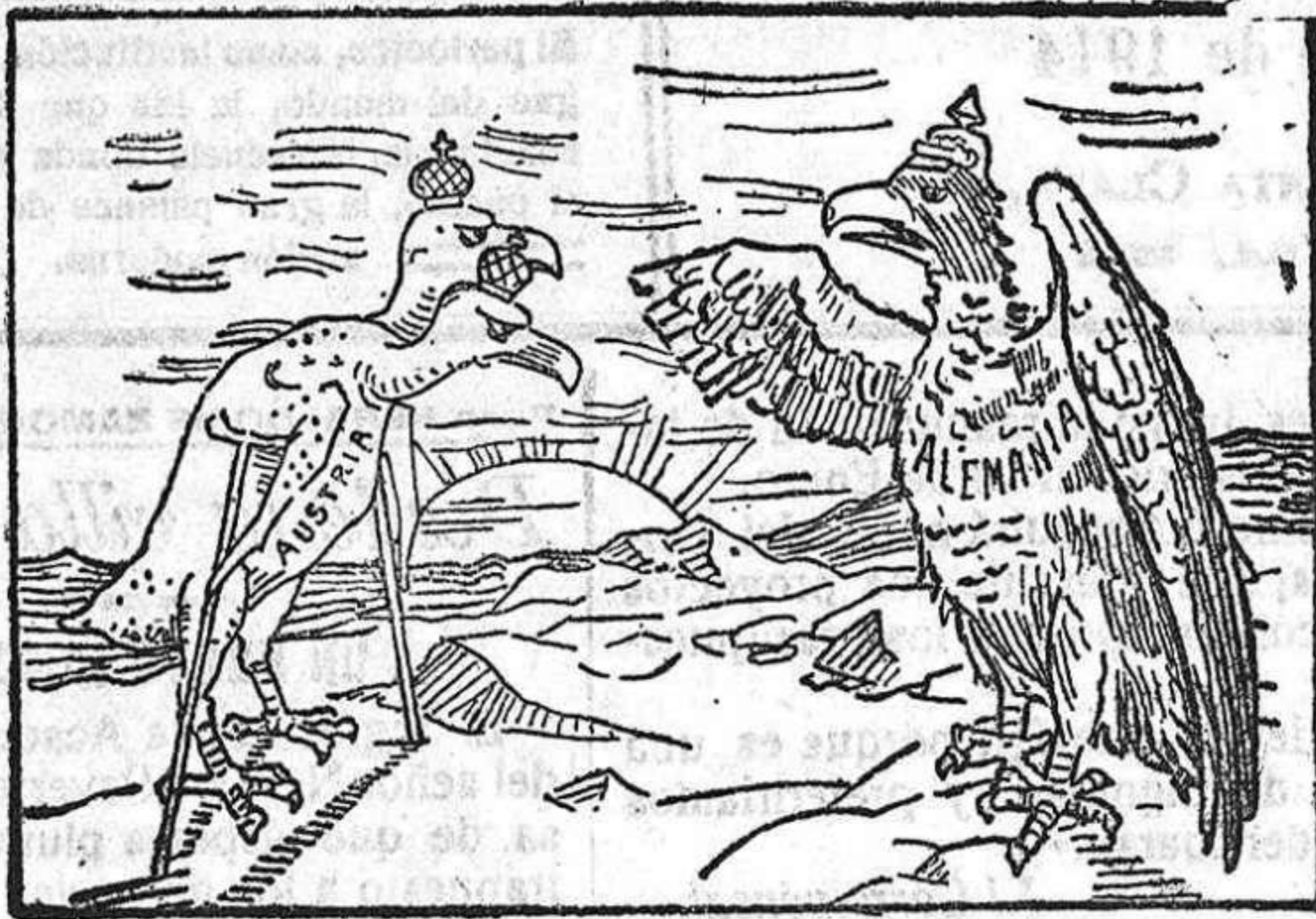
El águila prusiana.—Animo, hermana, que yo te prestaré alientos. El águila austro-húngara.—Más que alientos me hacen falta plumas. Ya ves como me ha dejado el oso y el invierno llega.