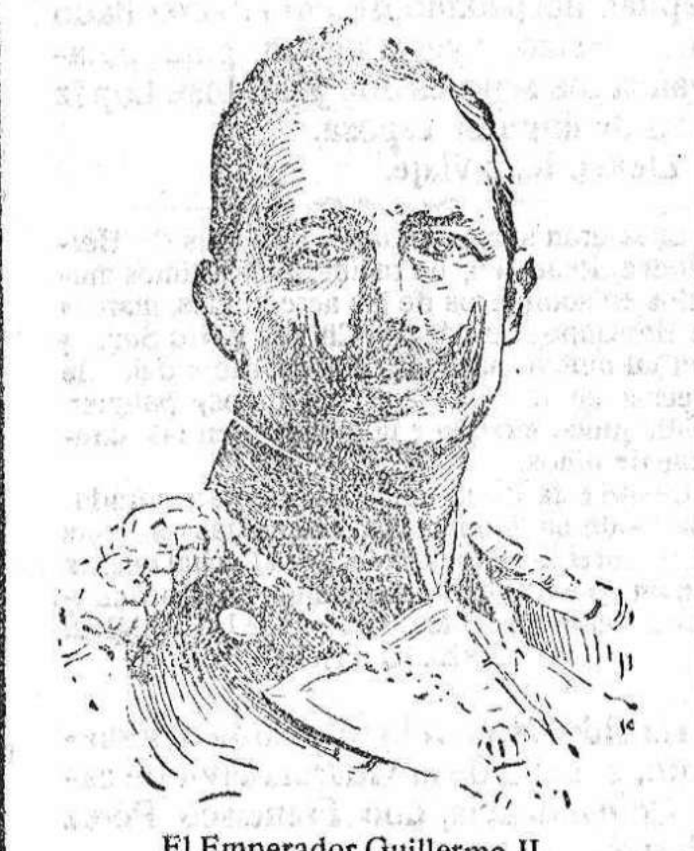
El Emperador Guillermo II.

Por notas oficiales, se sabe que Alemania está acumulando sobre la Croacia y la Prusia Oriental veintidós cuerpos de ejército, unos cuatro millones de combatientes, y también por conducto oficial se ha hecho público que Rusia ha terminado ya la movilización de sus ejércitos, lo que seguramente le ha de permitir oponer un número no menor de soldados a la ofensiva alemana.