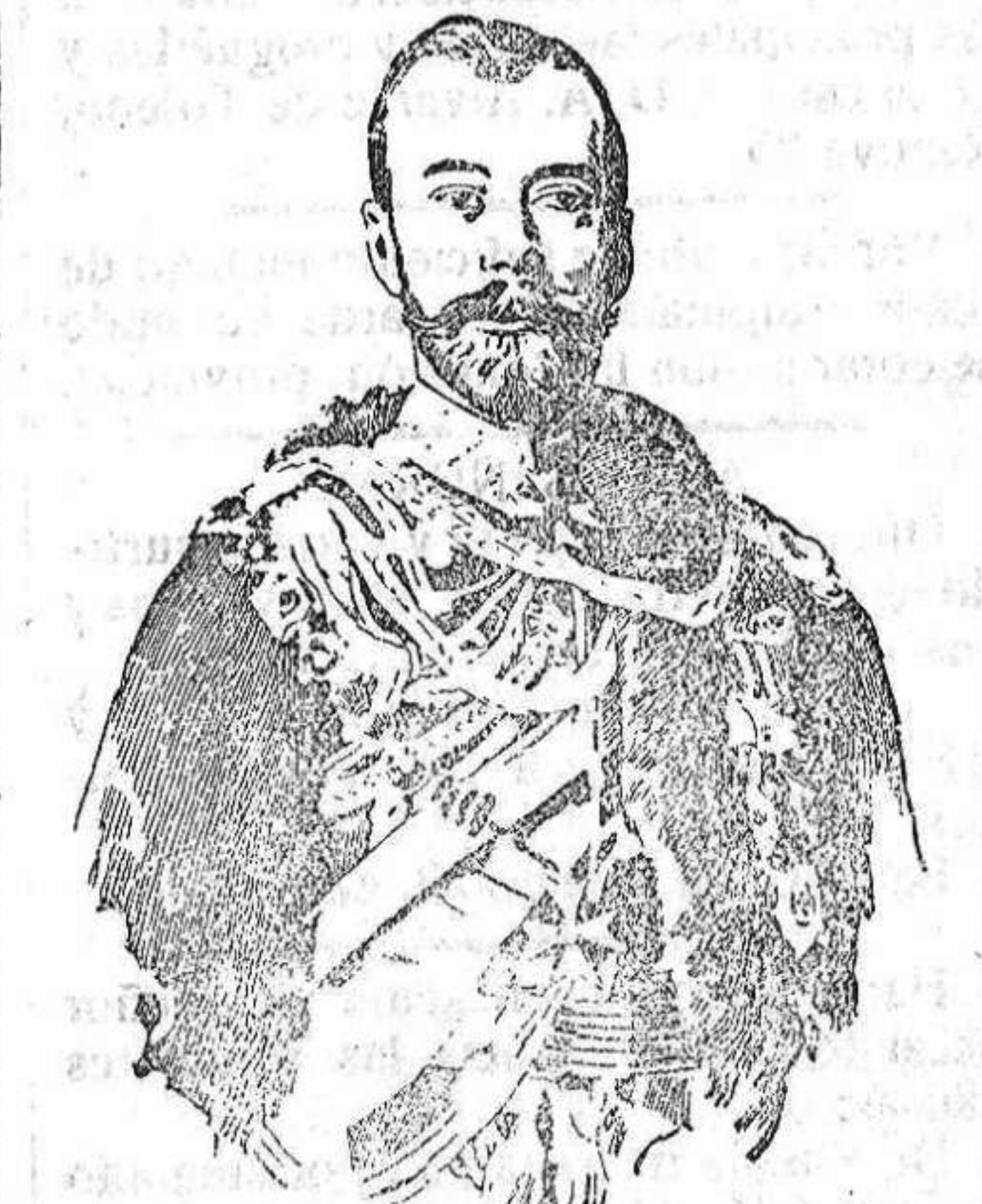
El Zar Nicolás II de Rusia.

El zar Nicolás y el emperador de Alemania se han puesto al frente de sus respectivos ejércitos, para hacerlos manobrar bajo su inmediato mando, para dirigir los formidables choques que han de tener efecto entre ellos, en las proximidades de las fronteras ruso-alemana y ruso-austrio-húngara. El hecho tiene importancia suma, porque demuestra que acaba de ser iniciada en la región del Niemen, han de comprometer los dos imperios enemigos cuanto le sea dable para obtener la victoria.