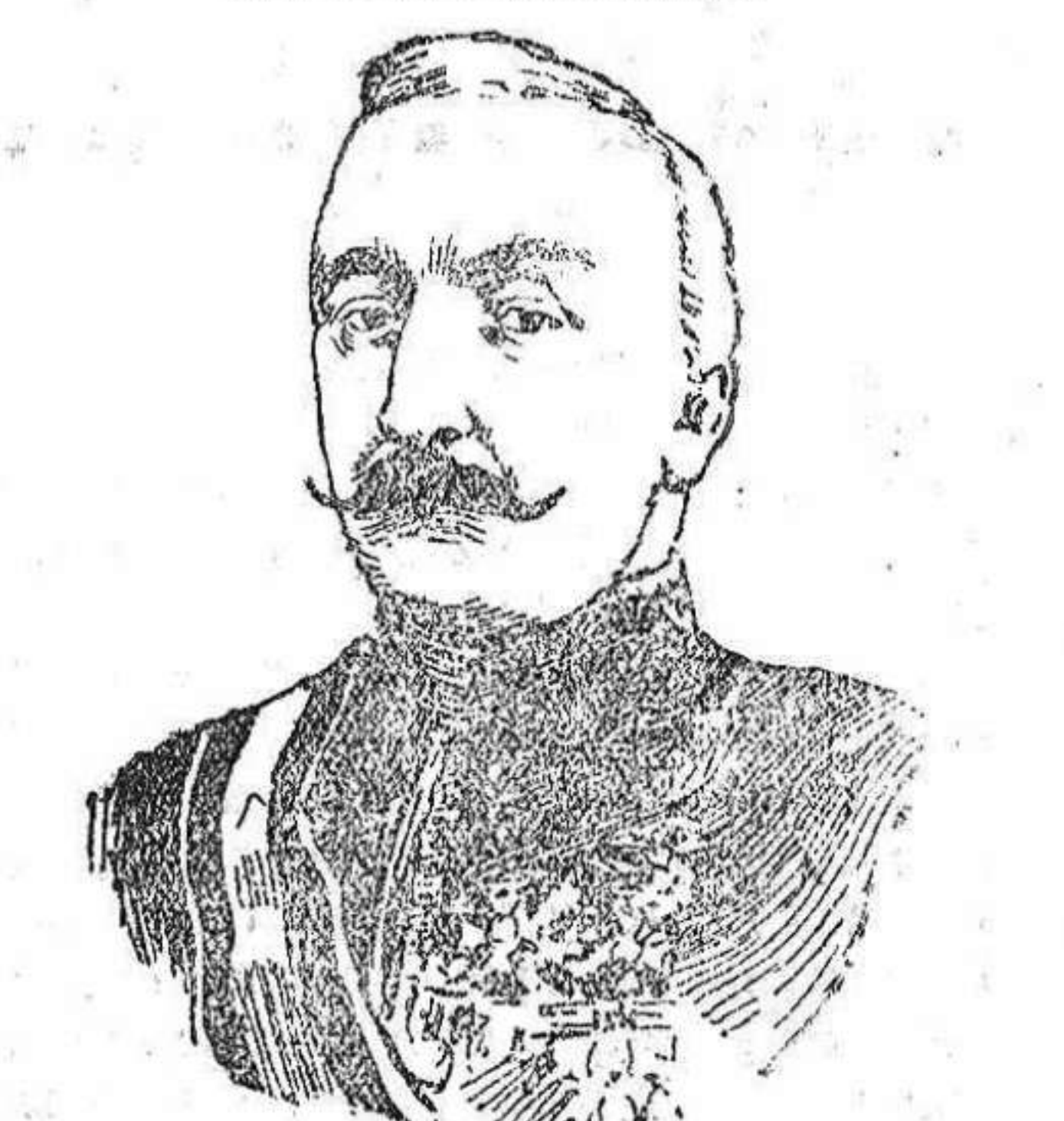
El presidente de la República Argentina, doctor don Roque Sáenz Peña, fallecido el lunes último.