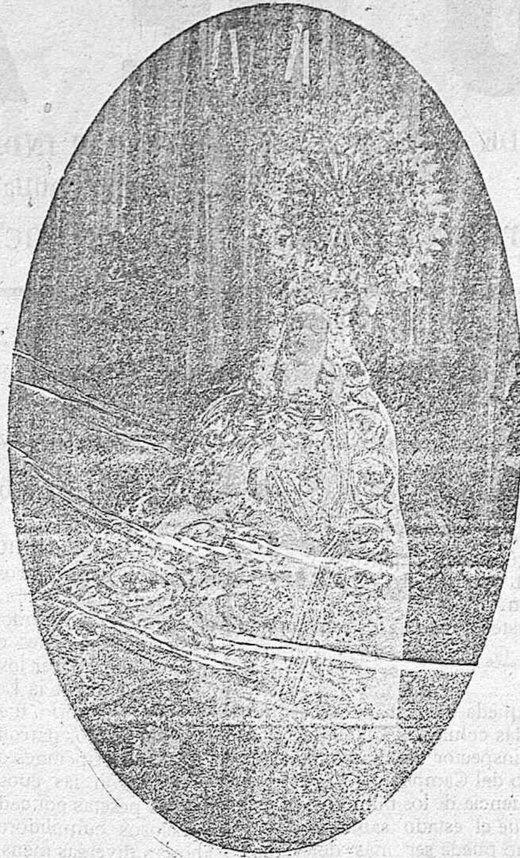
Nuestra Señora del Tránsito

el único que cura sin Baño. Véndese en todas las farmacias