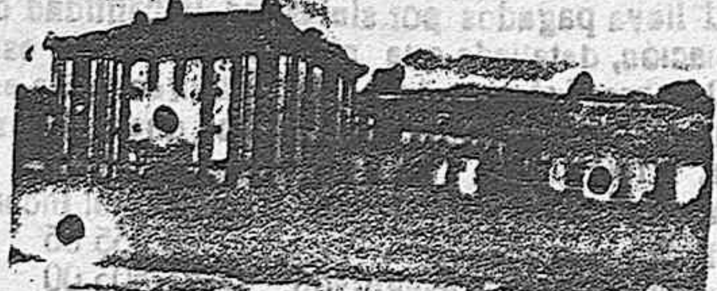
Sanatorio Quirúrgico del Dr. Madrazo