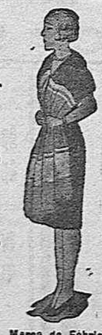
Marcas de Fábrica

EXIGID EN TODOS LOS ALMACENES Y ESTABLECIMIENTOS DE ULTRAMARINOS FINOS LOS PRODUCTOS DE ESTA FÁBRICA.