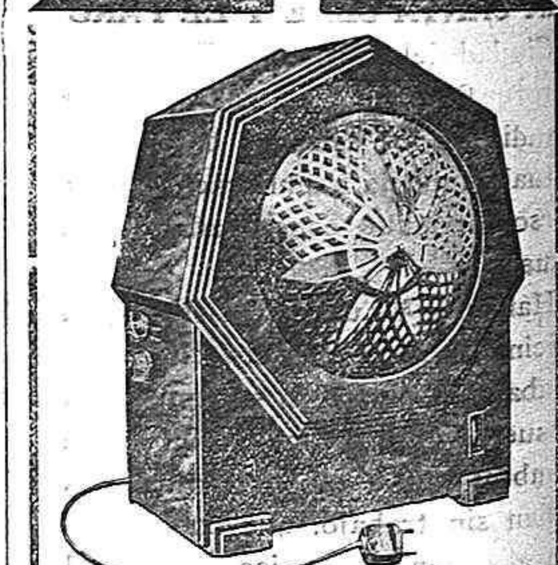
Receptor eléctrico PHILIPS

Al Gobierno se le juzgará por la obra que realice, y nuestra Monarquía, estoy seguro, permanecerá indivisible."