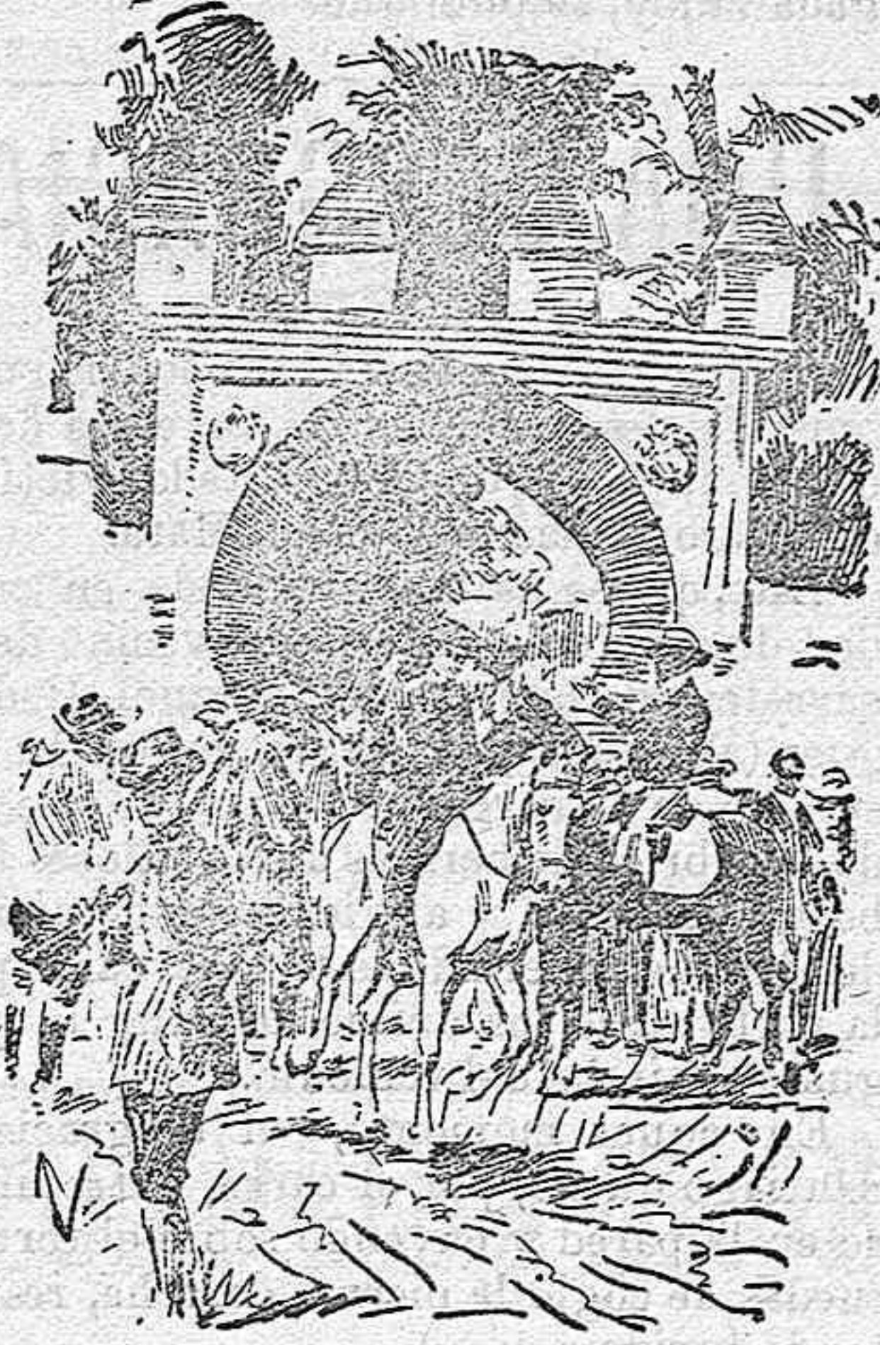
El rey en Láchar.