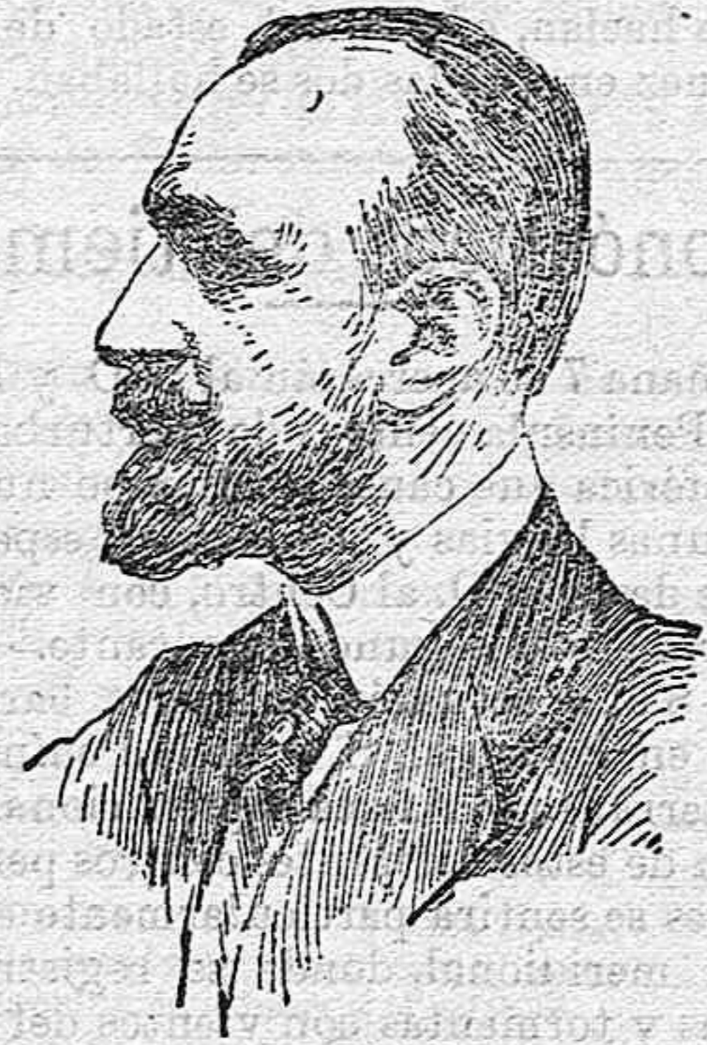
El Dr. Charcot.

Los trabajos de exploración comenzarán el día 15 de Diciembre á 800 kilómetros del Cab Horn y á una temperatura de 45 á 50 grados bajo cero.