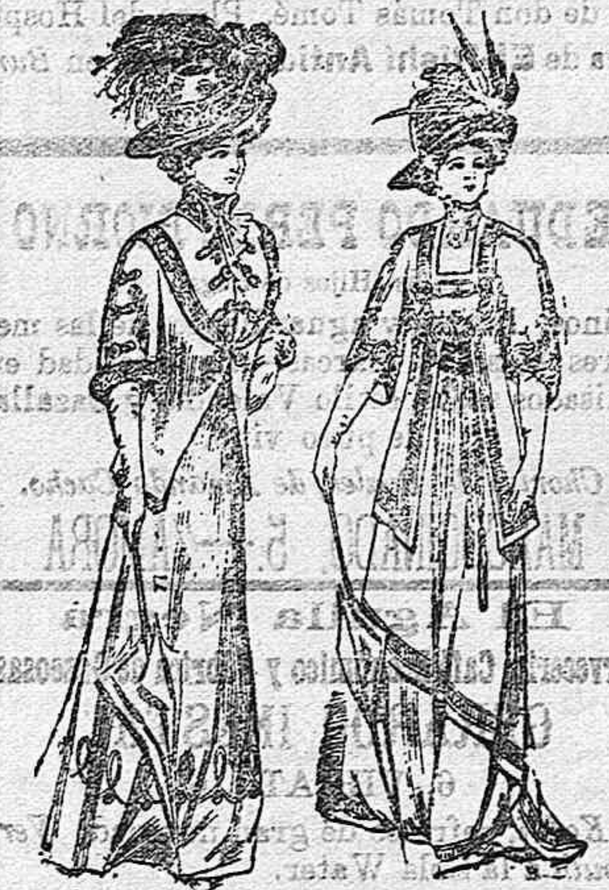
Traje para paseo.