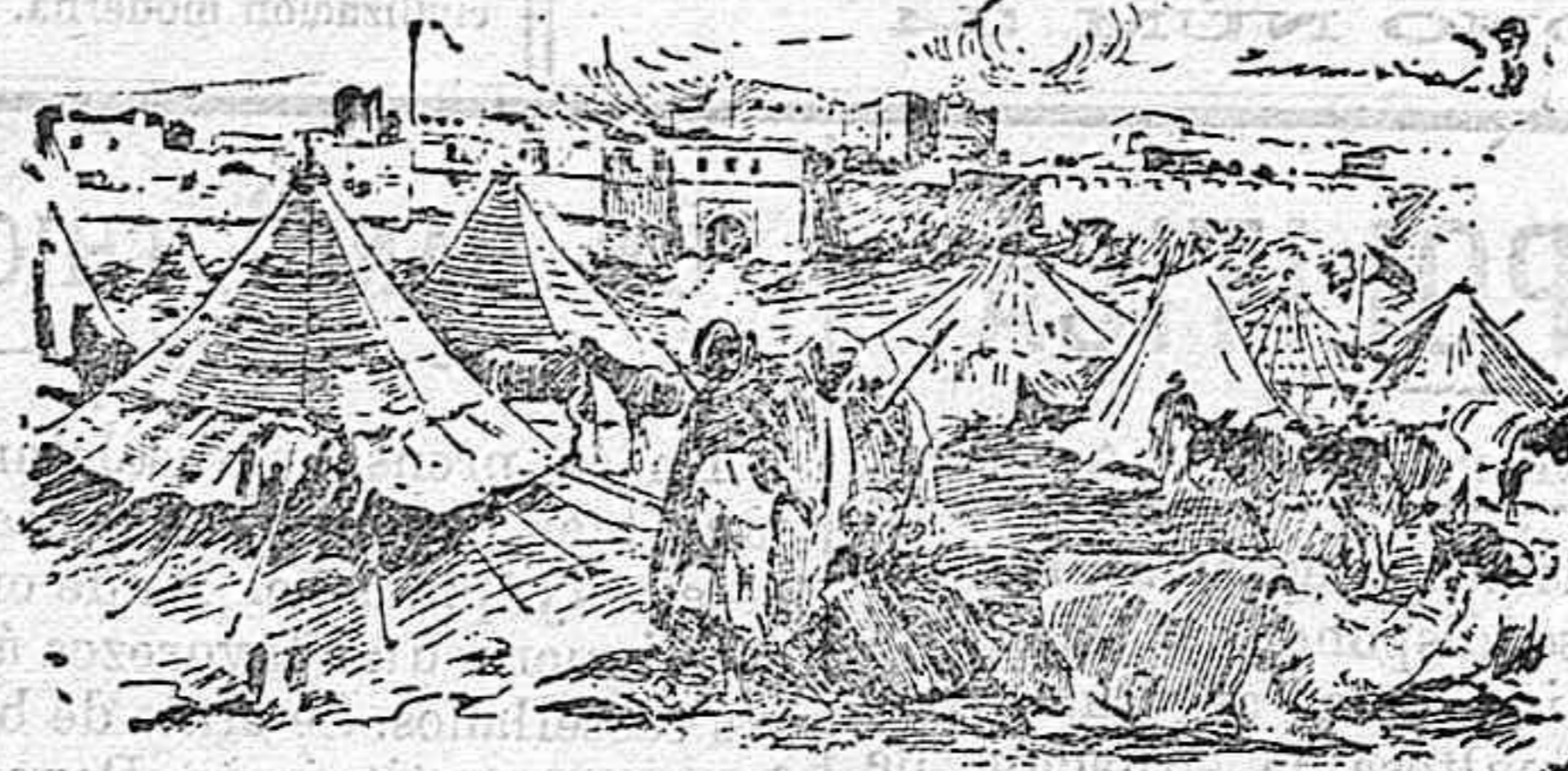
Campamento de la mehalla hafidista en las afueras de Tetuán.