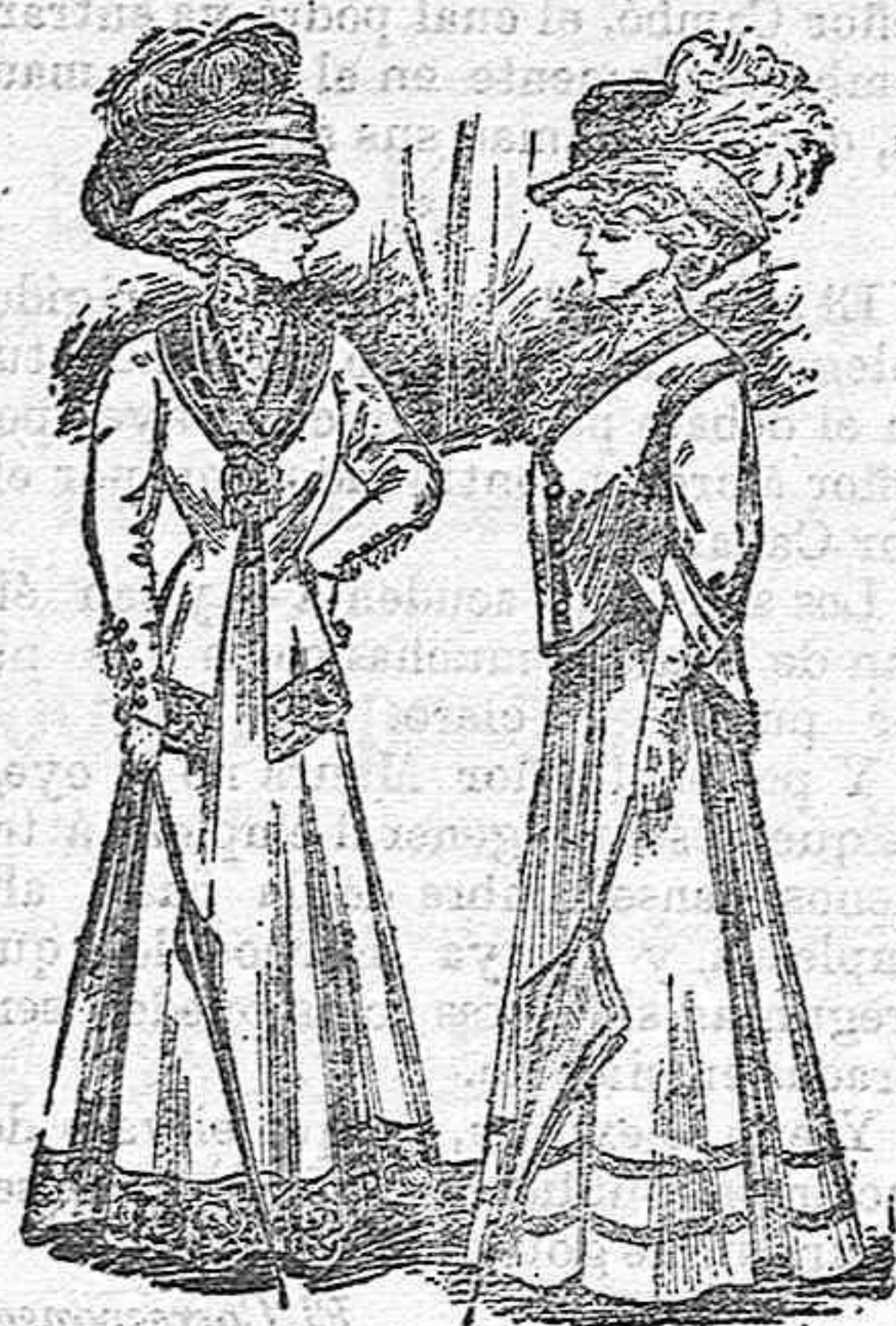
Vestidos para verano.