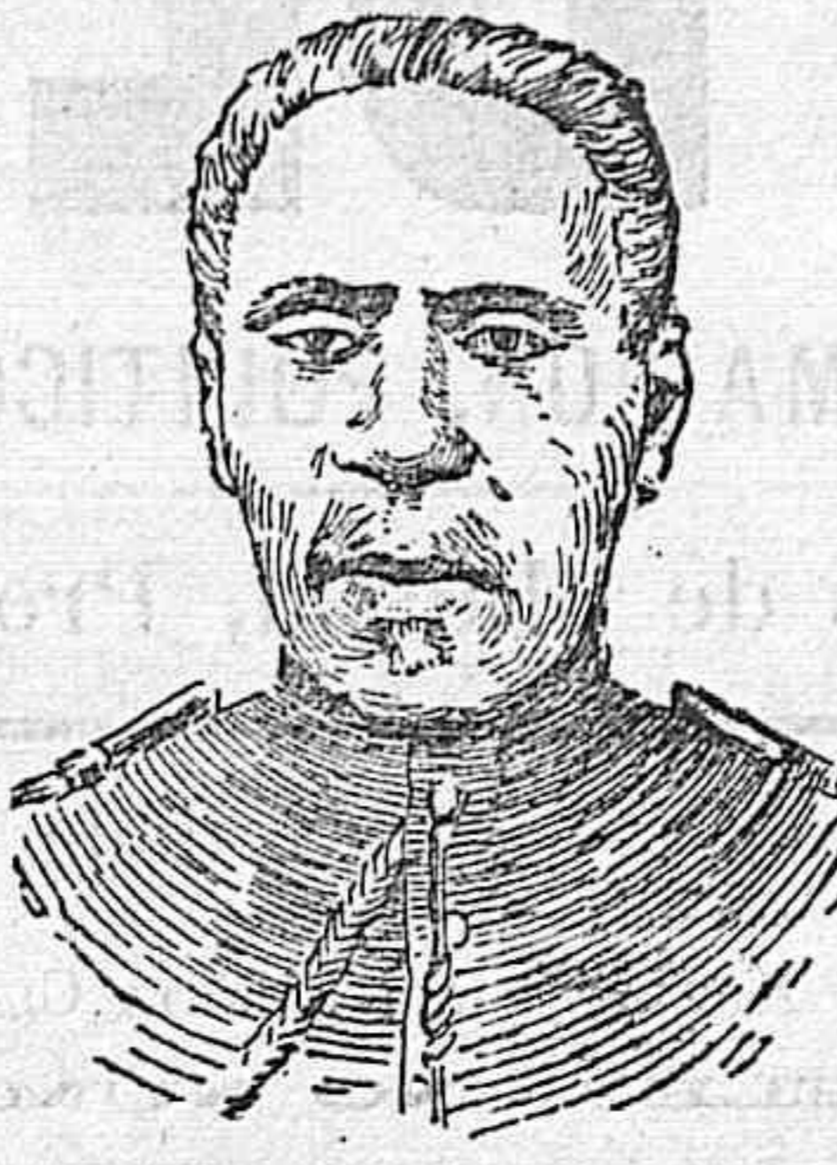
General Alexis Nord.

Lejos de restablecerse en Haiti el estado de tranquilidad interrumpido por la intención del general Firmin, la insurrección sigue latente y en estos días ha vuelto a recrudecerse, cual si los repetidos fusilamientos y las múltiples prisiones decretadas por el presidente Alexis Nord, fueran pólvora arrojada a la hoguera de la rebelión.