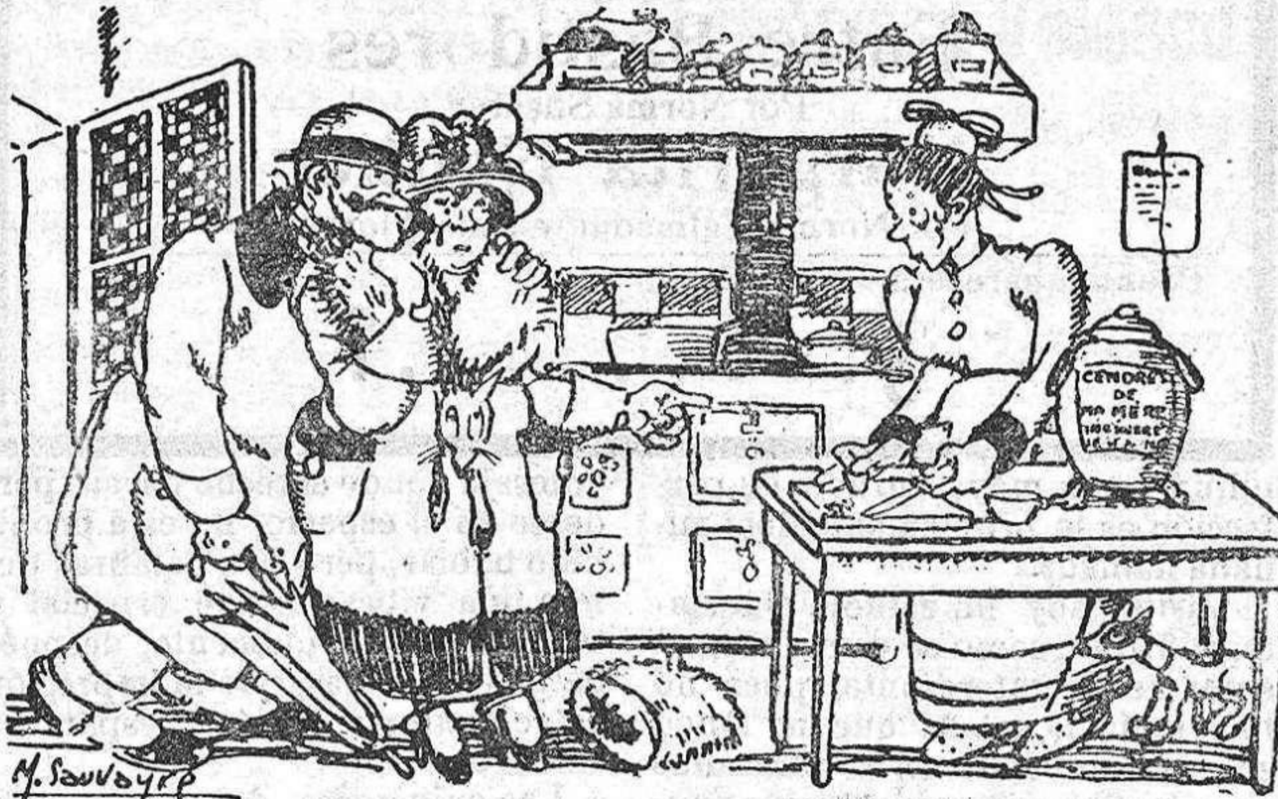
LOS ENCANTOS DE LA INCINERACION —¡Infame! Está limpiando los cuchillos con las cenizas de mi tío.