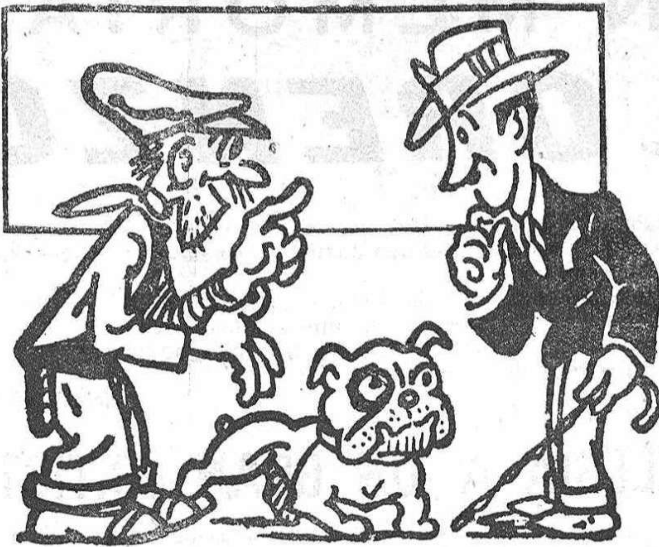
EL AMIGO DEL HOMBRE

Es la mar de noble, señor. Cuando empieza a gruñir como ahora, enseña los dientes y se le pone un ojo negro, lo hace para avisarme de que no se puede contener y quiere morder a alguien.