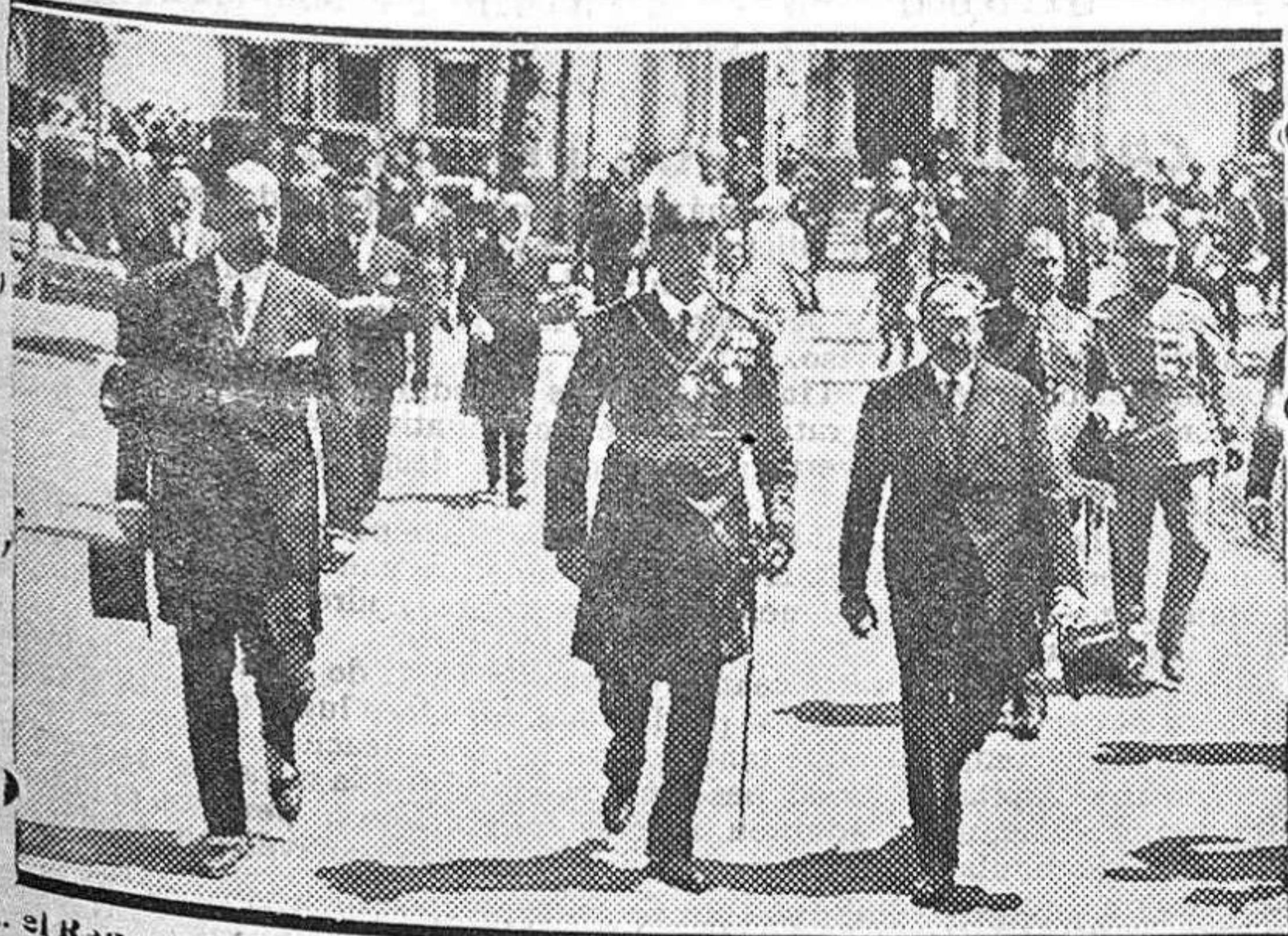
S. M. el Rey, en unión del representante de Bolivia y del director de la Exposición, a la salida del pabellón de dicho país.