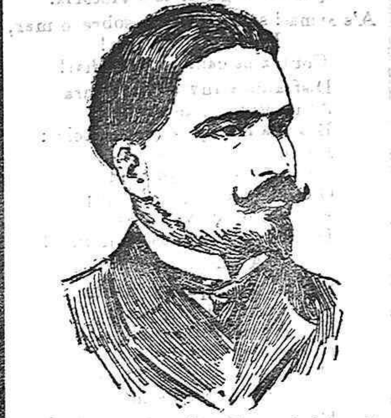
Antonio José de Almeida, ministro de la Gobernación de la República portuguesa.

Proposición incidental. La minoría republicana tiene acordado en principio presentar en la sesión del miércoles una proposición incidental al Congreso encaminada a conocer el criterio que el Gobierno se proponga adoptar para llevar a cabo el reconocimiento de la República de Portugal. El servicio obligatorio. En la Alta Cámara se ha reunido la Comisión del proyecto de servicio