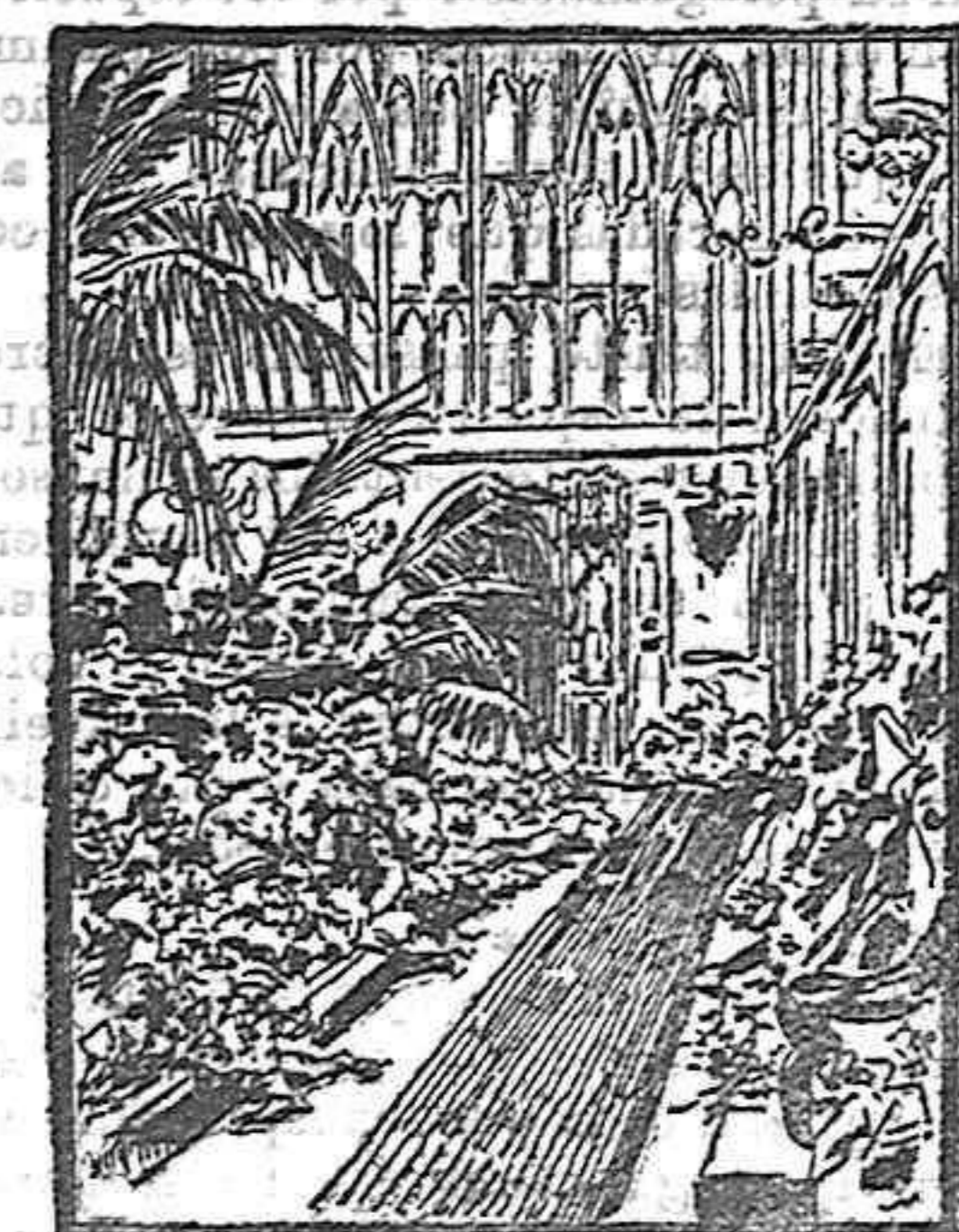
El cadáver de Eduardo VII en la capilla del castillo de Windsor durante los funerales.