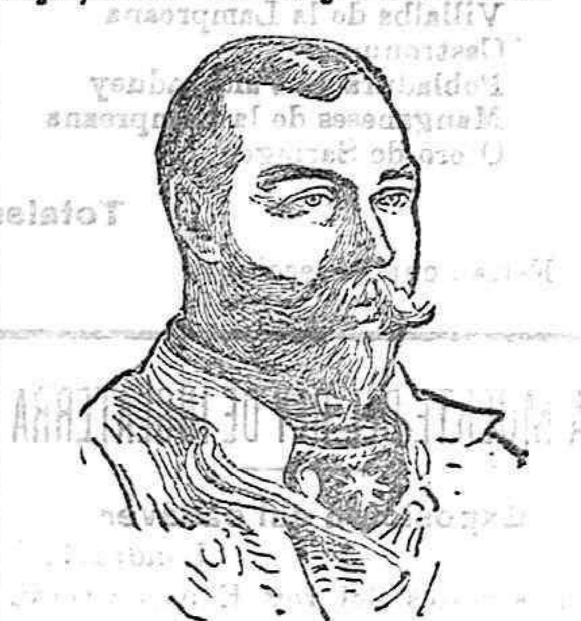
El nuevo soberano de Inglaterra, Jorge Federico.

El casi repentino fallecimiento de Eduardo VII, eleva al trono de Inglaterra al príncipe Jorge Federico, hasta el día 6 de corriente, príncipe de Gales, duque de Comwall, de York y de Rothesay, conde de Chester, de Carrh y de Inverness etc. etc. El nuevo rey de Inglaterra tiene en la actualidad 45 años, pues nació en Malborough H. nse el 3 de Junio de 1865. En 6 de Julio de 1893 casó con la princesa Victoria María, de Teck, de cuyo enlace han nacido seis hijos, cinco varones y una hembra.