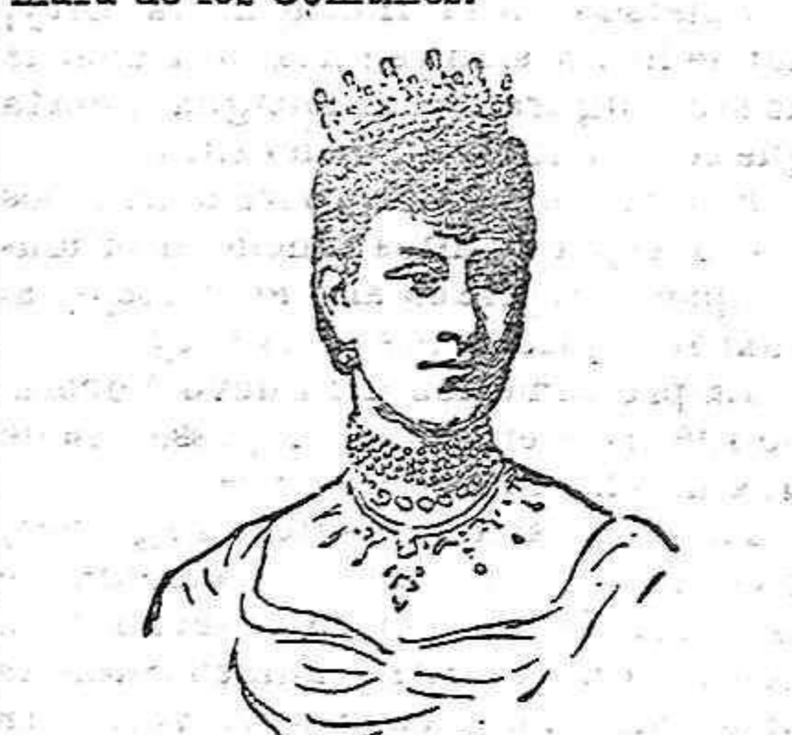
La nueva soberana de Inglaterra, Victoria María.

De carácter serio y grave, acoso debido a su constitución enfermiza, no obstante su robustez, siempre fué el príncipe Jorge Federico poco aficionado a los deportes y a las fiestas cortesanas. Páase grandes temporadas entregado a los afectos de su esposa e hijos en Malborough House, y en determinadas épocas consagra algunos días a visitar los puertos, fábricas y talleres, para estudiar la vida del obrero, el desarrollo fabril y comercial de la nación y la actividad industrial de sus subditos. Las marinas de guerra y mercante son igualmente para él motivos de detenidas observaciones y estudios, como también la política, viéndosele asistir con frecuencia a las sesiones de la Cámara de los Comunes. El nuevo soberano de Inglaterra, Victoria María.