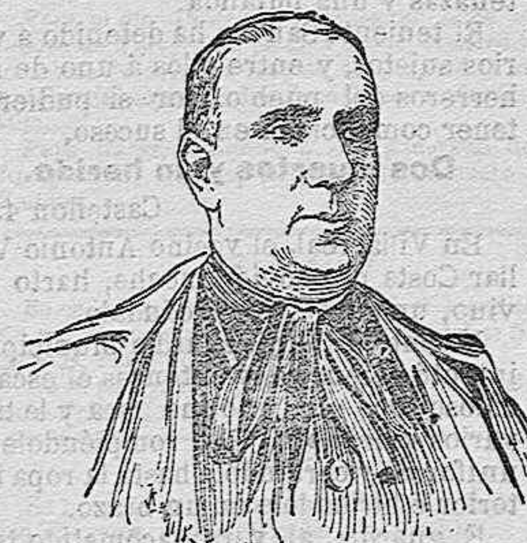
Los nuevos cardenales españoles.

Esto dijo la Noche; y el Tribunal que habla de juzgarla, reconoció que los males de que la acusaban no podían tener, en la balanza de la justicia, mayor peso que los beneficios que proporcionaba á los seres honrados.