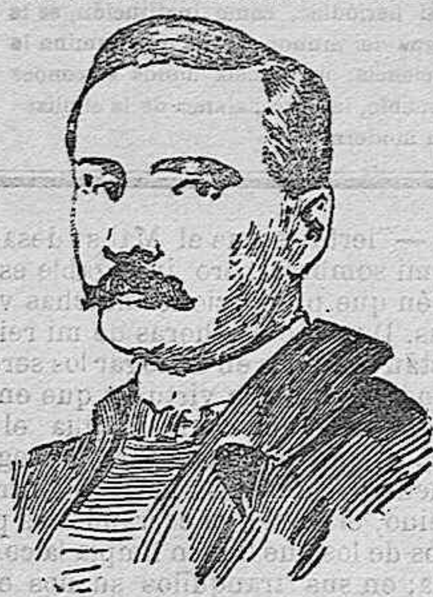
W. WIEN DI WURZBURG agraciado con el premio Nobel.