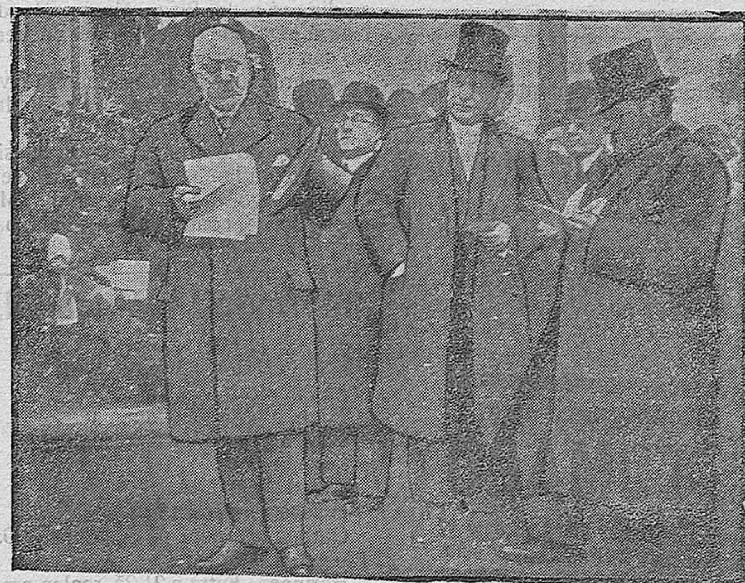
Celebrando el aniversario de Washington.