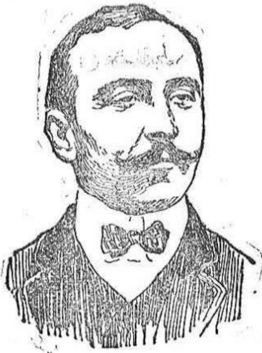
El maestro Villa.