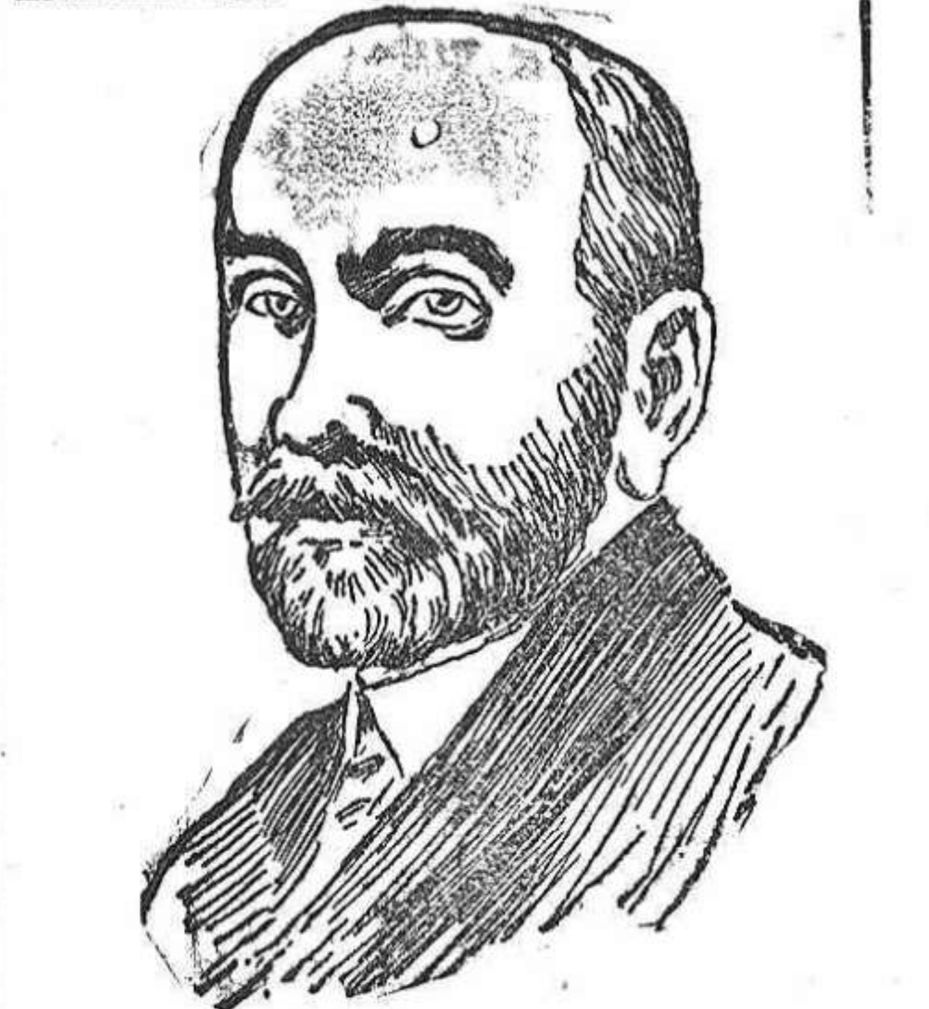
Una de las víctimas del fracaso de los aliados en los Balkanes. El ministro dimisionario de Relaciones Exteriores de Rusia, señor Sasonoff.

En Valladolid: Mercado del Canal.—La entrada ha sido de 400 fanegas de trigo, que se pagaron a 57 reales una.—Equivalentes a 32,95 pesetas los 100 kilos. Tendencia floja. Mercado del Arco.—La entrada ha sido de 400 fanegas a 57 reales.—Pesetas 32,95 los 100 kilos. Tendencia floja. Se vendió ayer trigo procedente de Sahagún a 58,25 reales fanega.—Pesetas 33,67 los 100 kilos; de Ros, Peñaflor y Quintanilla a 58,50.—Pesetas 33,81. Han llegado 32 vagones de trigo, 1 de harino, 1 de alverjones, 3 de cebada y 1 de maiz.