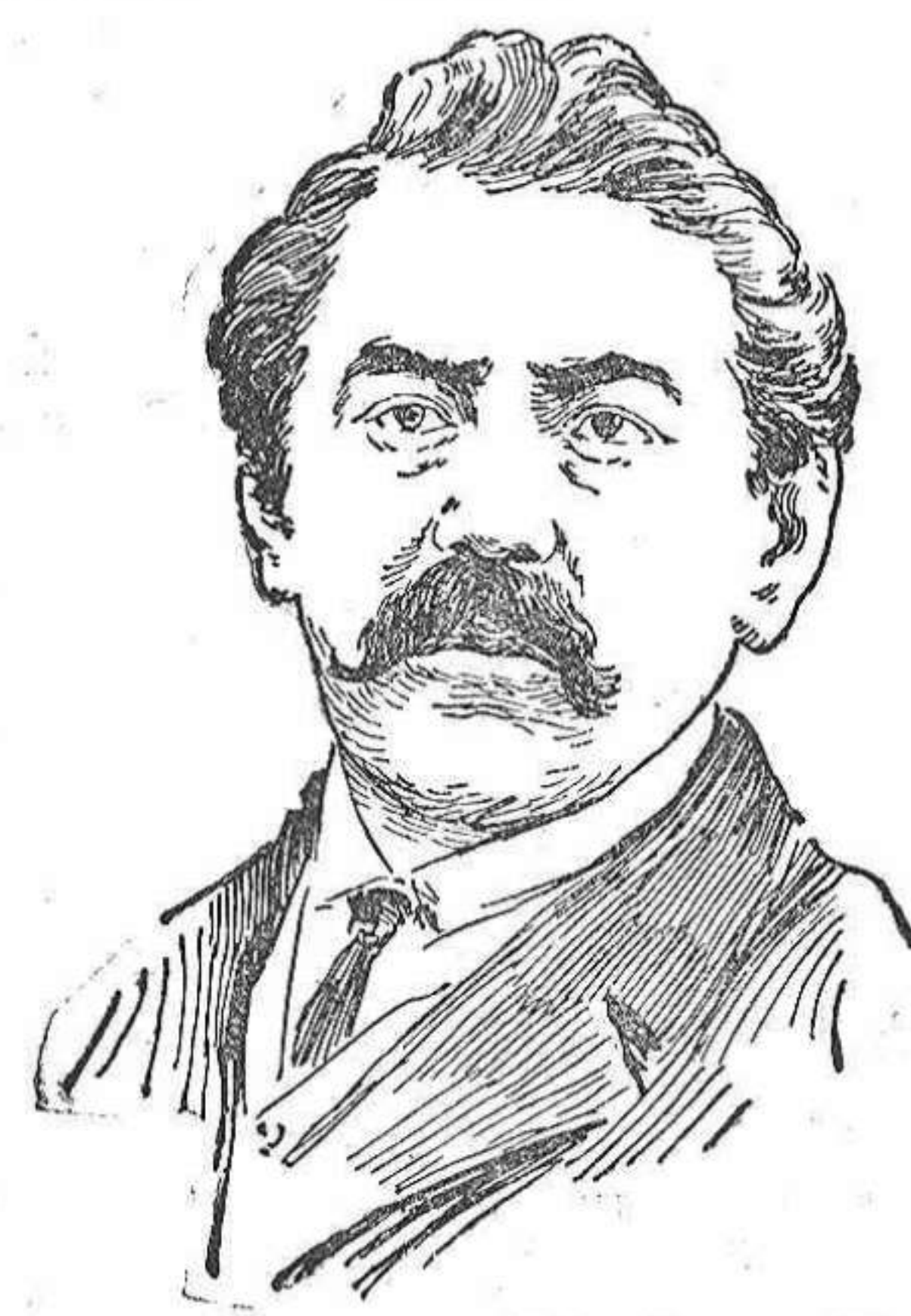
Monsieur Aristides Briand, presidente del nuevo gabinete francés y ministro de Negocios extranjeros.

Equipos para novias y canastillas. Rueda, Santa Clara, 2.