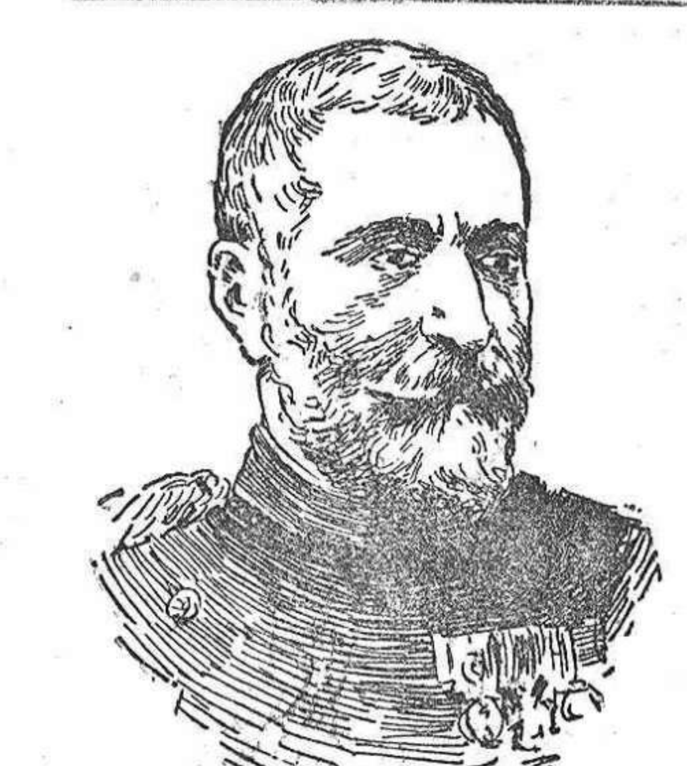
General Putnik, que ha presentado su división de generalistas del ejército servio.