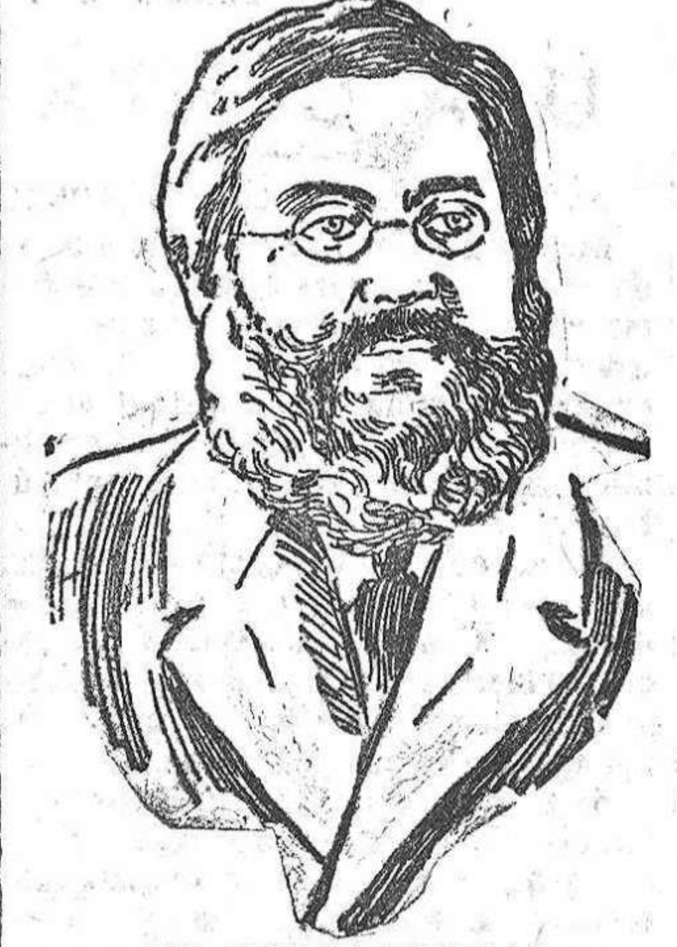
MR. ALBERT THOMAS ministro de municiones de Francia.