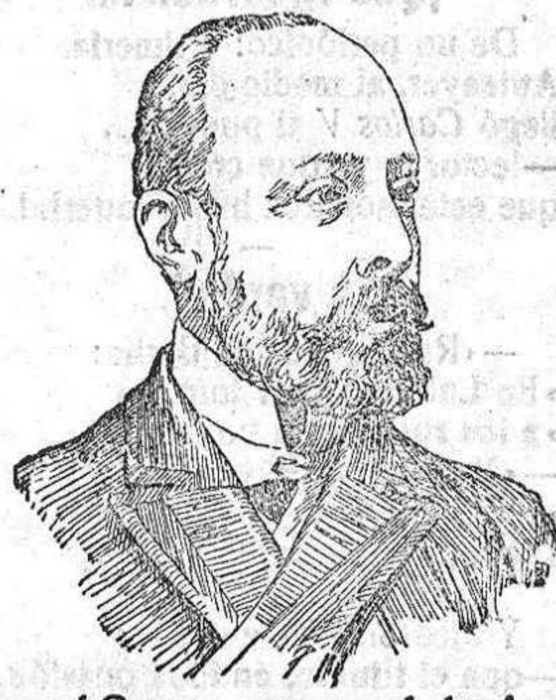
General Caneva, que manda las fuerzas italianas que avanzan por la Carniola