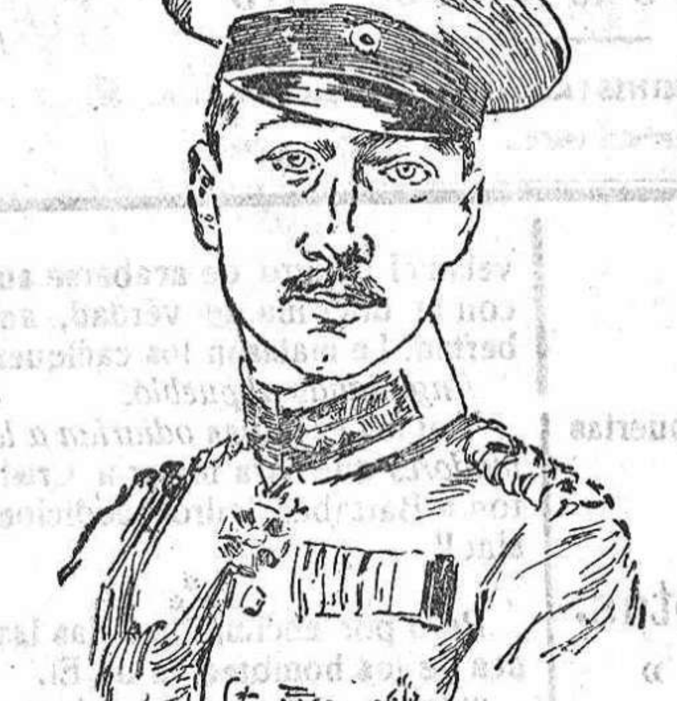
El Kromprinz de Alemania que según rumores se halla enfermo en una casa de Potsdam.