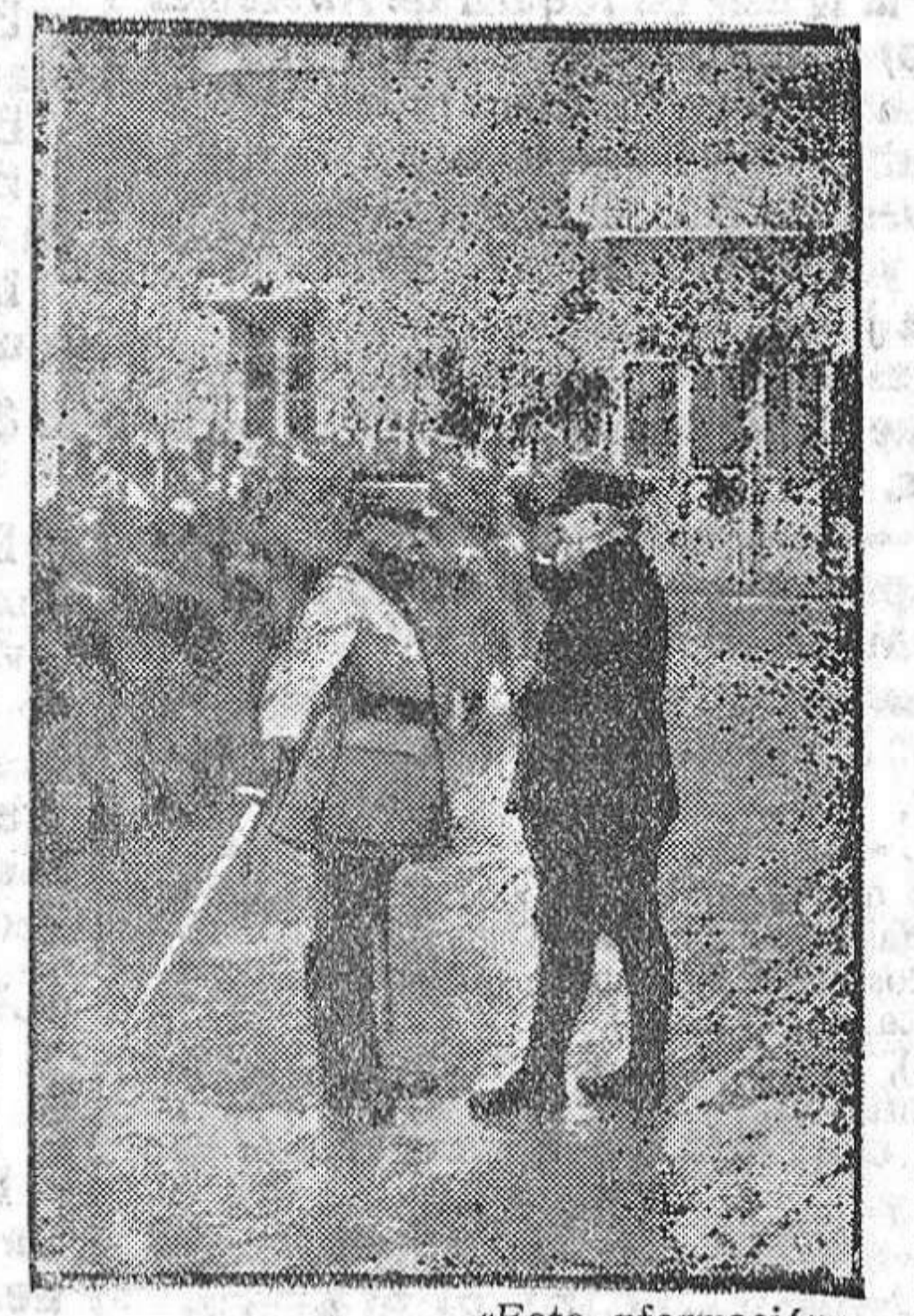
«Foto-información» El presidente de la República francesa, Mr. Poincaré, condecorando al general Mangin por su heroísmo en la defensa de Verdún.