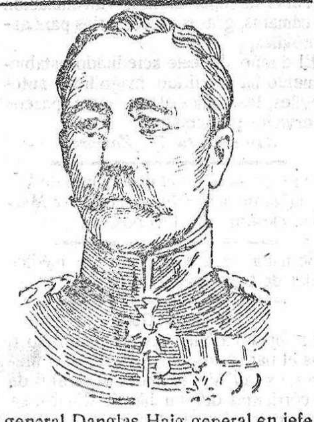
El general Dangles Haig general en jefe del ejército inglés que ha tomado la ofensiva en Picardía contra el frente alemán.