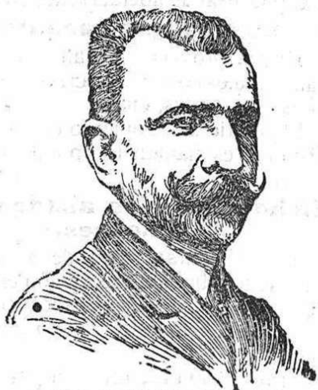
DON AMALIO JIMENO nuevo ministro de Estado.