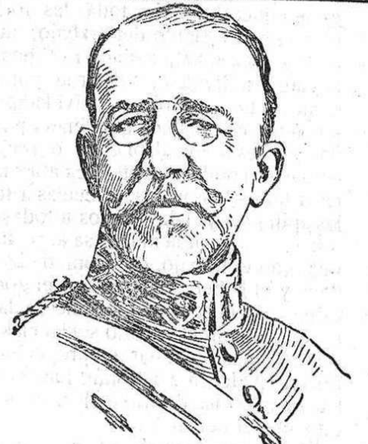
DON JOAQUIN RUIZ JIMENEZ nuevo ministro de Gobernación.

En este lindo y antiguo coliseo, siguen proyectándose esta noche los episodios de la película «La Llave Maestra» de extraordinario éxito y atracción.