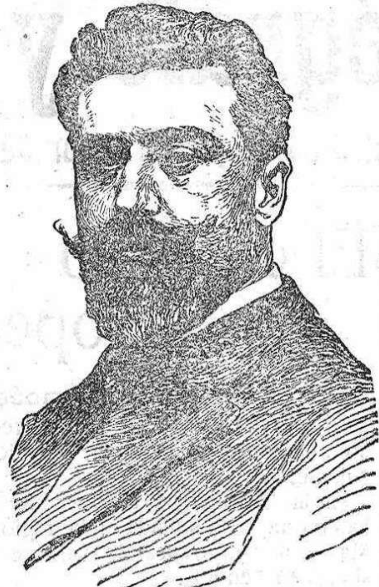
DON SANTIAGO ALBA nuevo ministro de Hacienda.