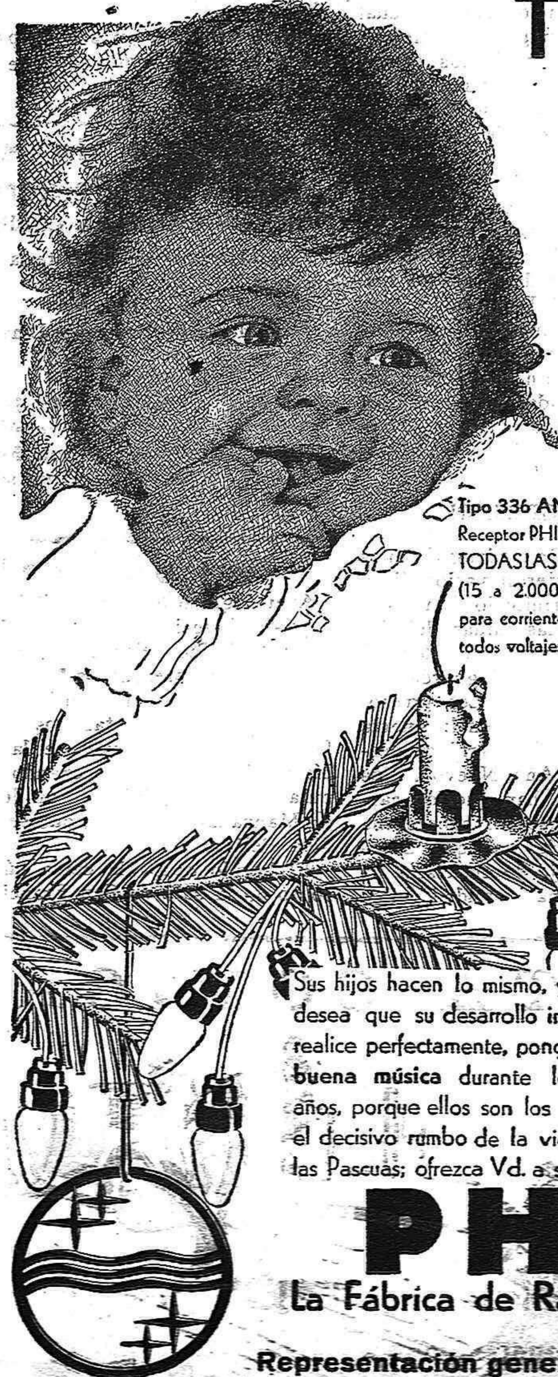
Tipo 336 AN.—Nuevo Receptor PHILIPS para TODAS LAS ONDAS (15 a 2000 metros), para corriente alterna, todos voltajes.

Es el balbuceo de la niña que imita los primeros sonidos que oye; repetidos cariñosos y maquinalmente por sus padres. Y cuando apenas se puede incorporar en la cuna, grita con toda la fuerza de sus pequeños pulmones al oír la música en la habitación o en la calle.