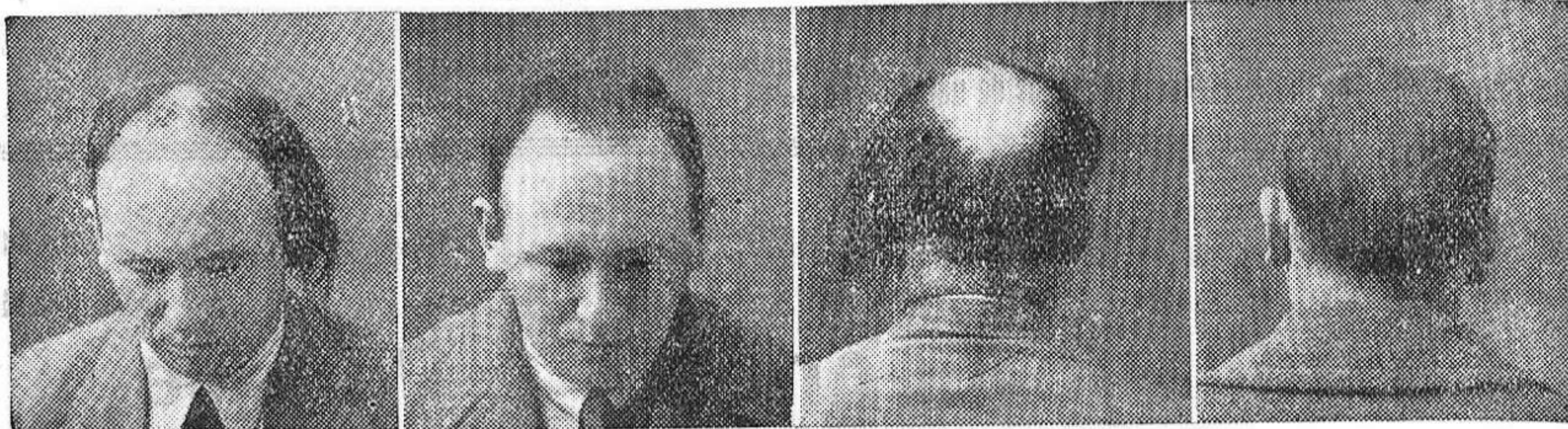
10 años calvo 5 meses tratamiento 10 años calvo 5 meses tratamiento

Desinfectante, 10 pesetas. Capilar, 20 pesetas. Curación completa de la caída del pelo, 5 frascos, y de regalo uno de capilar.