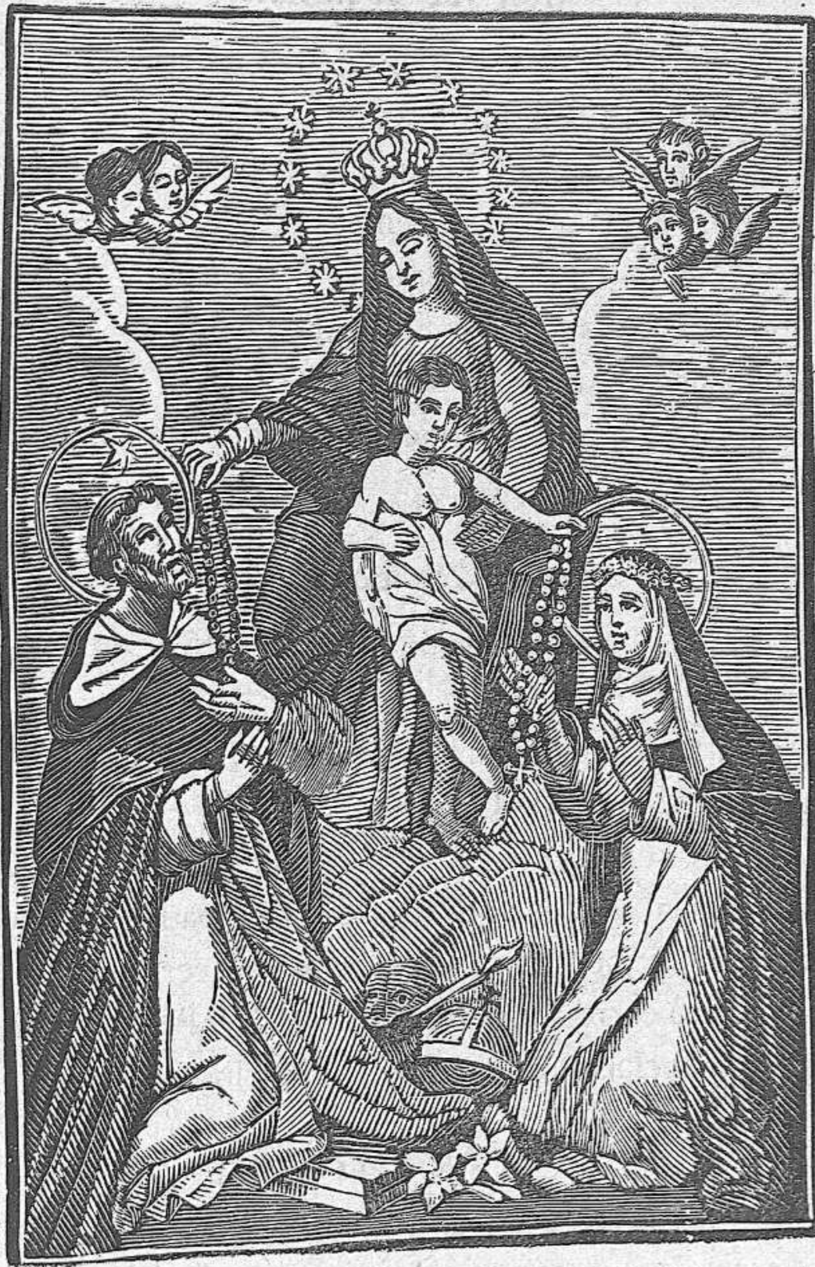
Nuestra Señora la Virgen del Rosario