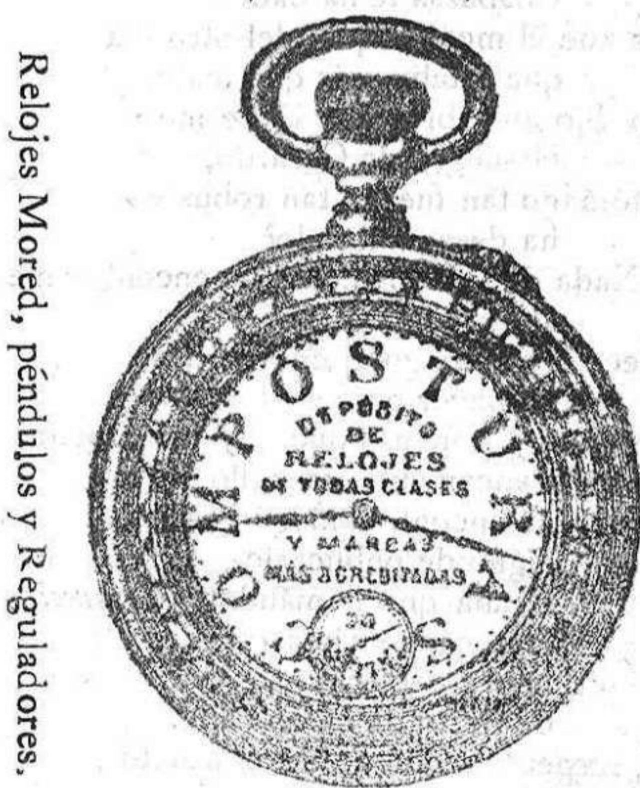
Relojes Mored, péndulos y Reguladores.