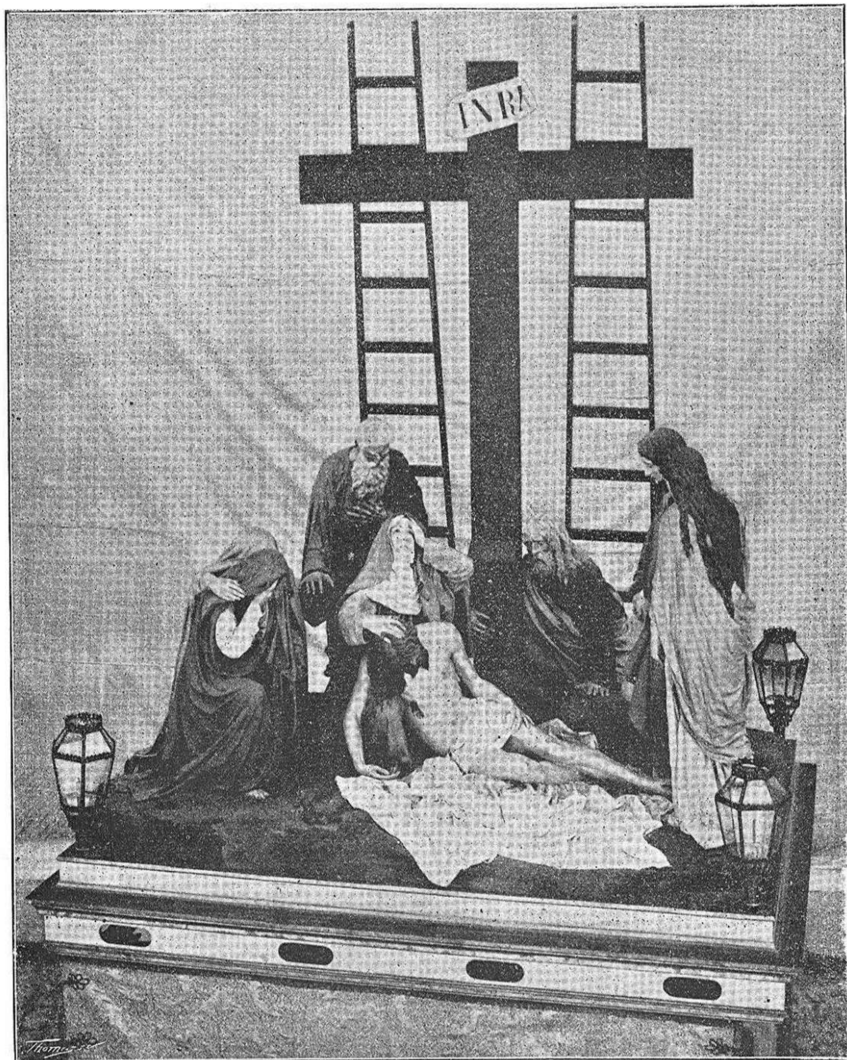
JESÚS DESCENDIDO.—OBRA DEL NOTABLE ESCULTOR DON MARIANO BENLLIURE.

La antigua iglesia de San Torcuato exhibe uno que el ya citado señor Muriel pintó el año 1884 y que se compone, en primer término, de cuatro columnas dóricas imitan-