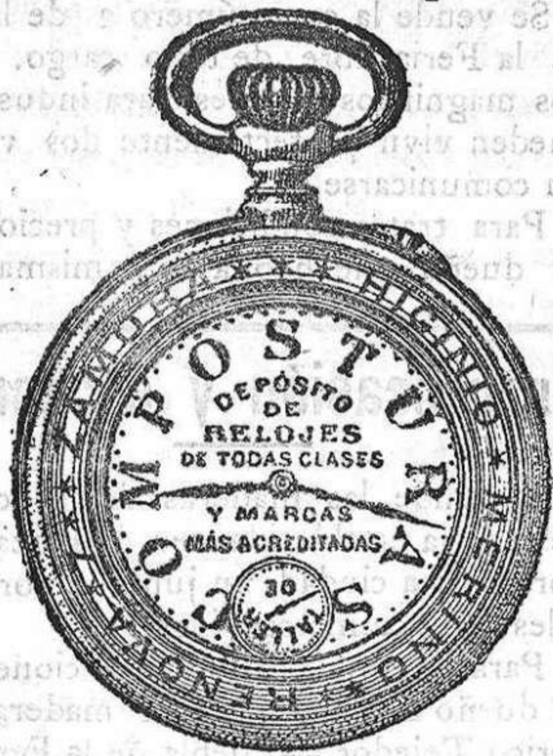
Relojes Mored, péndulos.