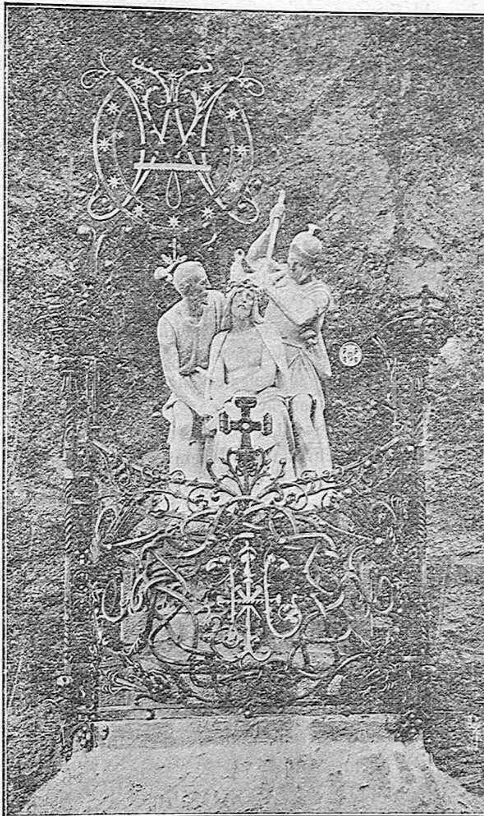
CORONACIÓ D'ESPINES—MISTERI TALLAT EN MARBRE DEL ROSARI MONUMENTAL DE NONSERRAT.

Desolat amb sobrenatural desolució se mos presenta el calvari el dia que Jesús morí. De la mateixa manera amb el meteix es-