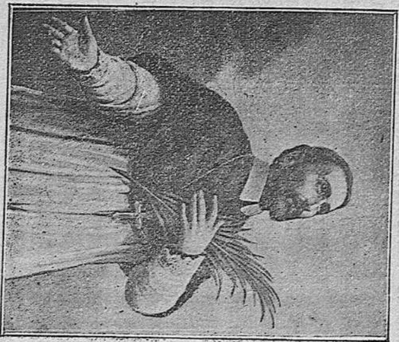
Beato Marcos Crisino

Grabado de un cuadro usado en su beatificación