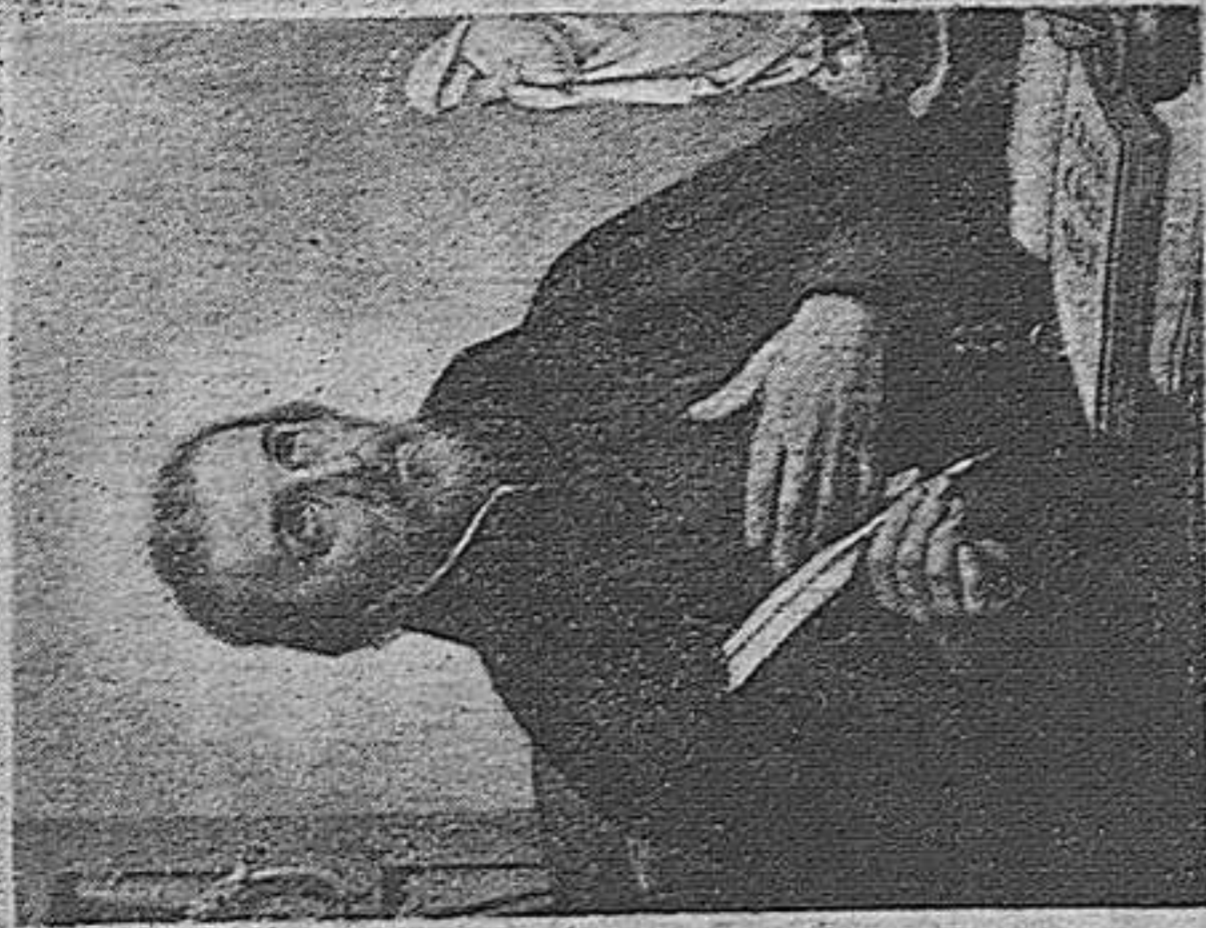
B. PETER CANISIUS - 21 Dec.

Be not led away with various and strange doctrines. - Heb. XIII. 9.