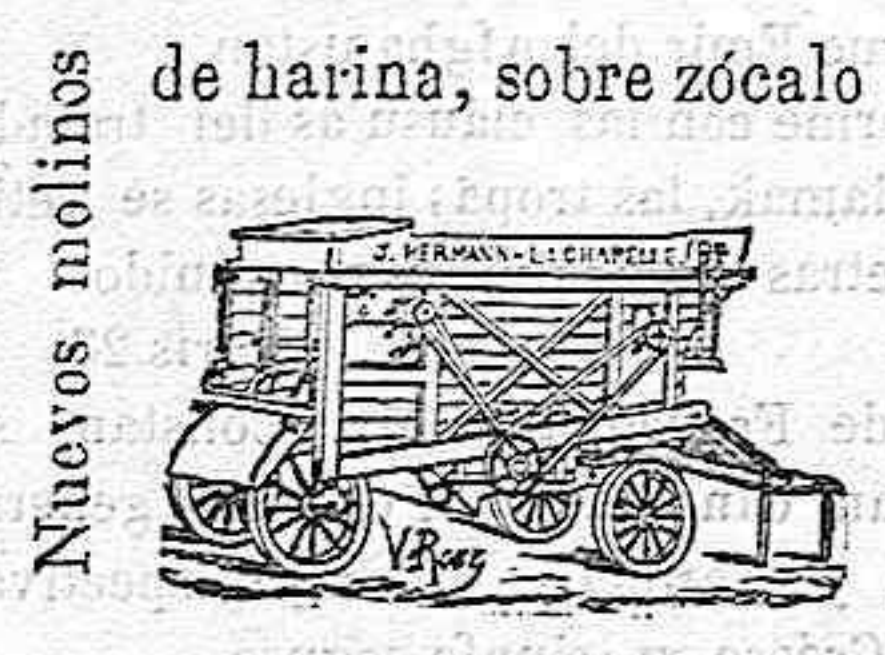
Nuevos molinos de harina, sobre zócalo de hierro.