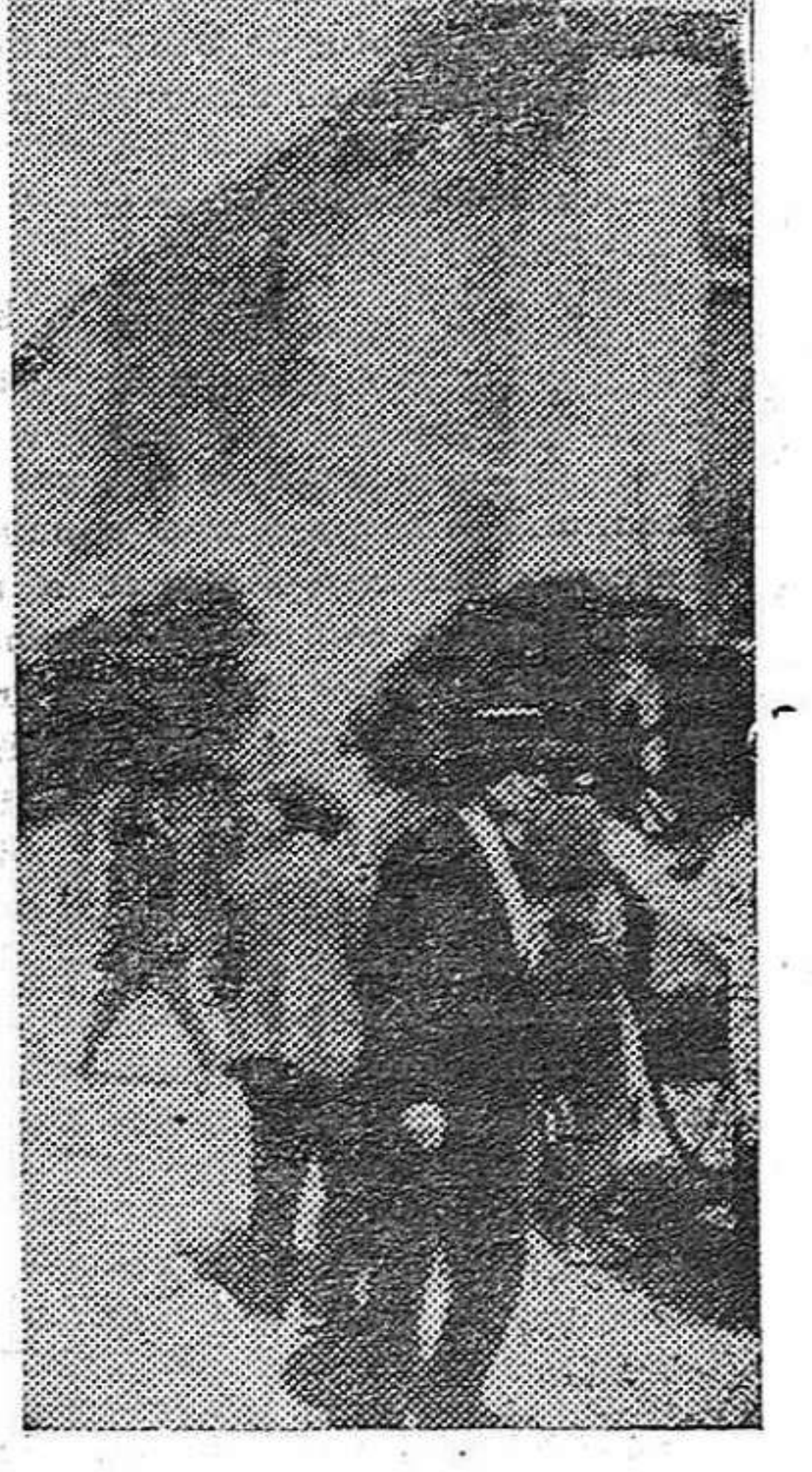
Llegada del material municipal de incendios al lugar de la catástrofe.