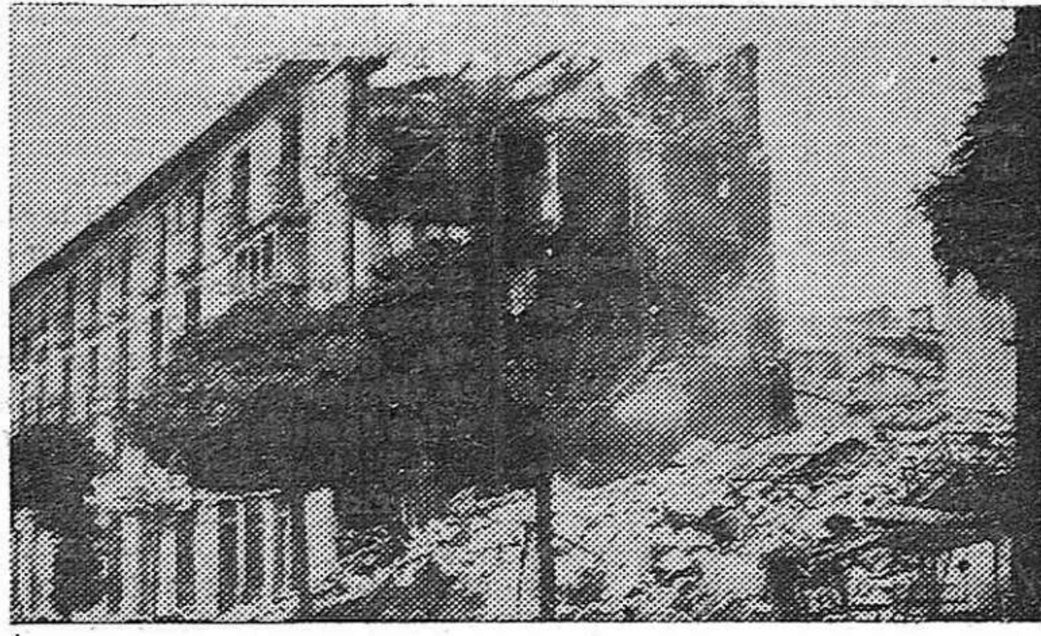
DEL INCENDIO DEL MARTES.—Estado en que quedaron las casas incendiadas, vistas por la Calle de Marqués del Vadillo.

Las autoridades de Soria reunidas con urgencia manifestando opiniones, la del Jefe político que es partidario de defender el fuerte a toda costa y la del Ayuntamiento que cree mejor no oponer resistencia si los enemigos de la Constitución se acercaran a la ciudad. El ejército permanente sale de Soria y acampa en Almazán, la caballería de la Milicia Nacional voluntaria, dedicada a observar al enemigo, le hace en Rello 12 prisioneros y ambas fuerzas vuelven a sus cuarteles sin haber sufrido ningún encuentro serio. En los primeros meses de 1823, últimos de este período constitucional, el enemigo es mucho más numeroso y fuerte, la facción tiene sus reales en Burgo de Osma, y en Francia esta ya preparando el ejército que al mando del Duque de Angulema va a cumplir los acuerdos de la Santa Alianza modificando el sistema político. Entonces Soria hace sus últimos aprestos, abastece sus tropas regulares, dota con 60 cartuchos cada plaza de la Milicia Nacional guarda junto a la torre del puente del Duero los palos de los barrenos que han de volarle caso de ser atacado. El personal del Concejo, que sabe la suerte que le espera con la invasión nombra las personas que han de sustituirles y les encomienda la defensa del fuerte. Estos acontecimientos ocurren en los primeros días de Abril de 1823. El 7 de este mes los franceses de Angulema traspasan el Pirineo y los generales de la Constitución van capitulando sin resistencia. El Ayuntamiento de Soria, acaso an-