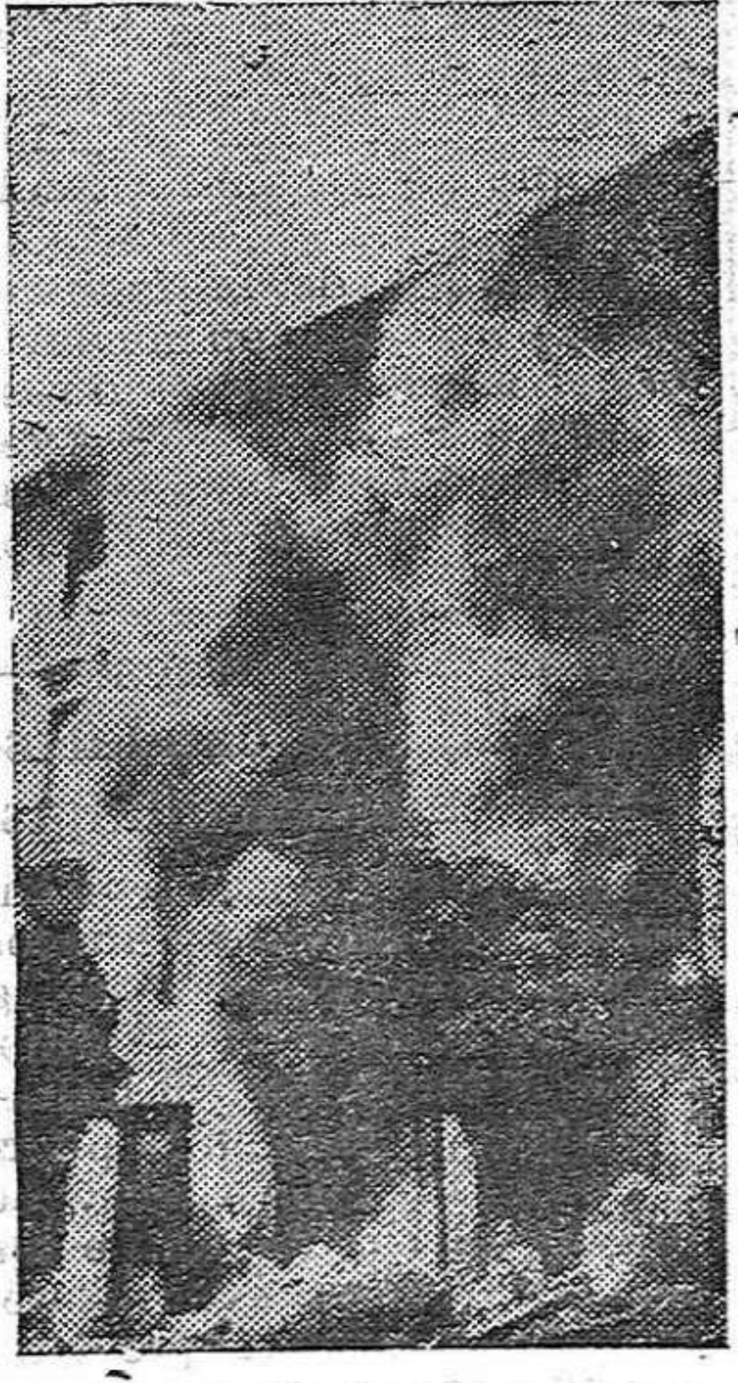
Las casas de la Plaza de Acaña momentos después de iniciarse el incendio.