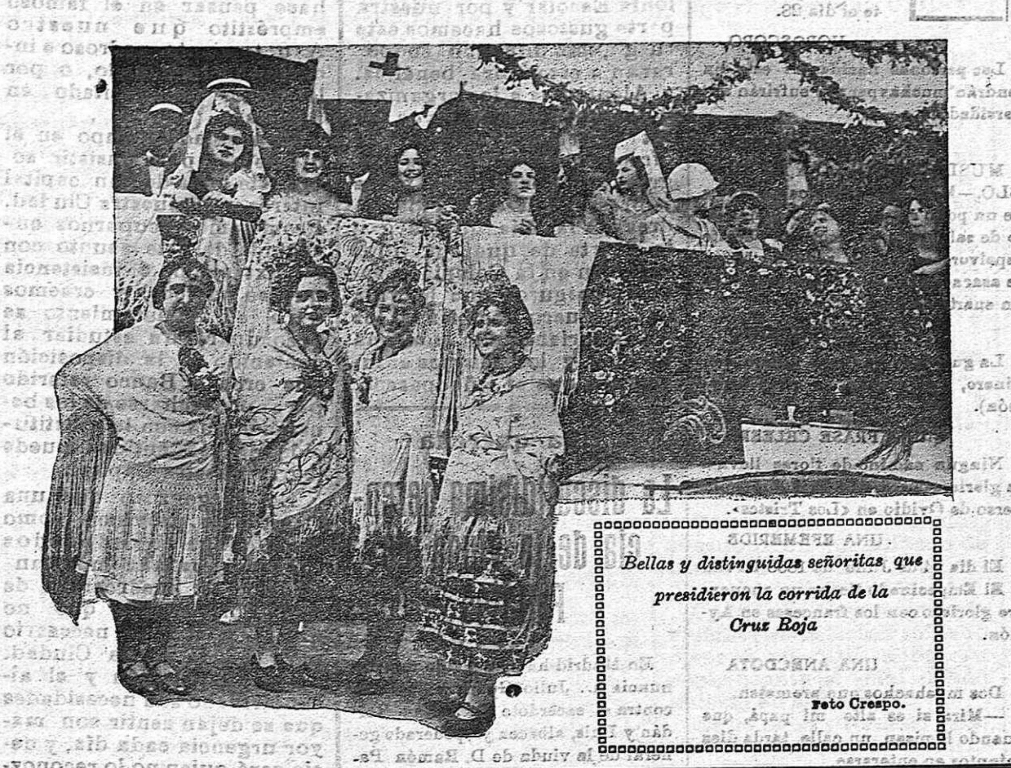
Bellas y distinguidas señoritas, que presidieron la corrida de la Cruz Roja.

El Consejo acordó aceptar la donación, haciendo constar la gratitud de España. Se acordó asimismo requerir a la Junta de ampliación de estudios, con objeto de que este organismo, las bases para el concurso de adquisición de terrenos que sirvan para la construcción del edificio de que se trata. Por el ministerio de Instrucción pública, y con toda urgencia, se iniciará y remitirá al de Hacienda el oportuno expediente de crédito extraordinario para el pago de los gastos de los terrenos.