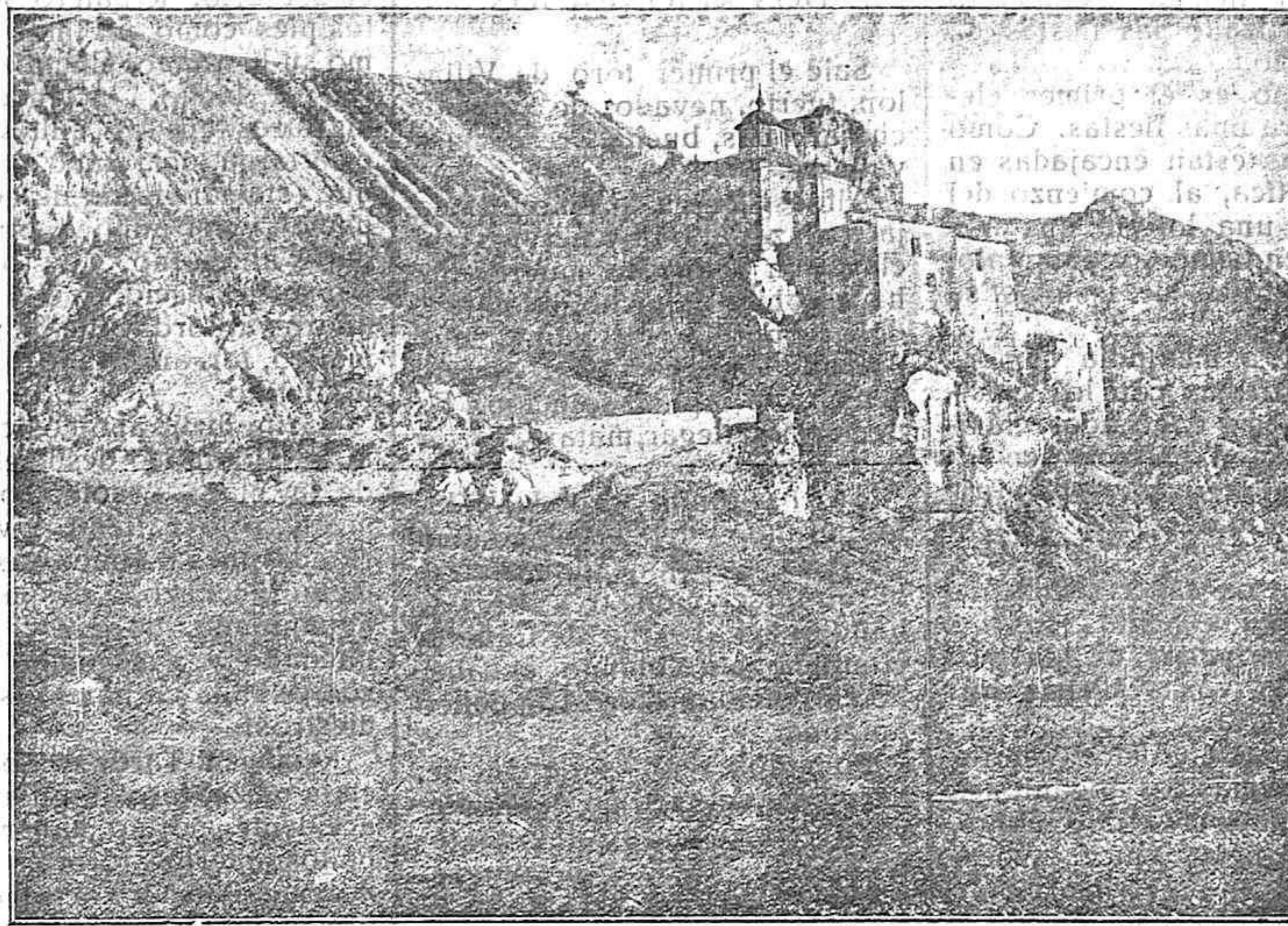
Ermita donde se venera la imagen del Santo y en cuyo lugar se celebrará mañana la romería.