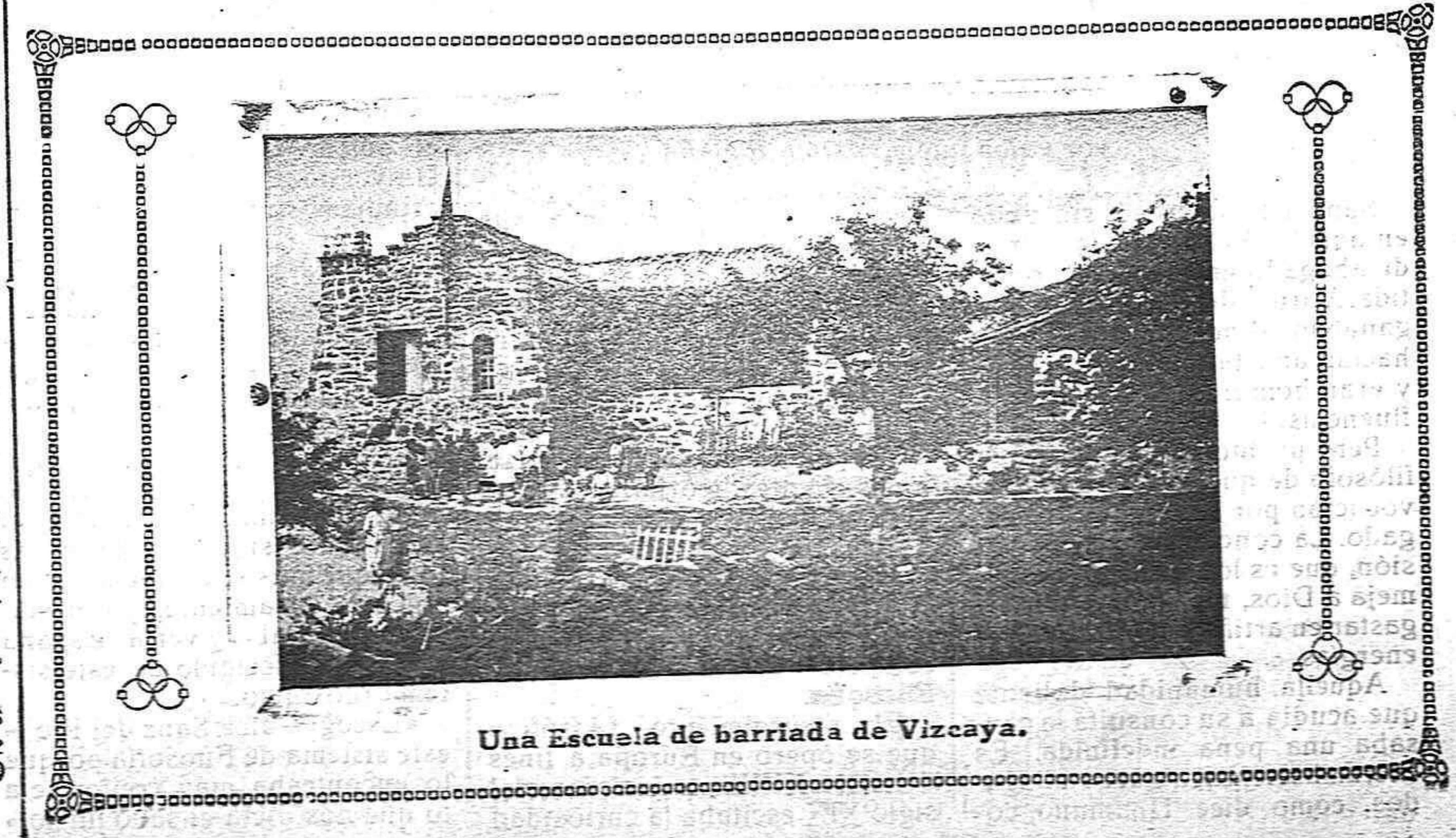
Una Escuela de barriada de Vizcaya.

carles prácticamente las lecciones de régimen penitenciario. En el curso de la inspección, profesor y alumnos detuvieronse ante un hombre de feroz aspecto que, tras los barrotes de una reja, daba la sensación de fiero. El catedrático acercóse al recluso y a fin de que sus discípulos estudiaran un caso práctico interpelló al preso de esta forma: — Digame, ¿en la comisión del delito por usted perpetrado hubo dolo? — Lo que que hubo fueron «muchísimos» riñones— contesto el preso enfurecido creyendo que le tomaban el pelo. El maestro, azorado, tartamudeó una explicación, y los estudiantes hicieron grandes esfuerzos para reprimir su hilaridad. Tienda y amplios locales para almacenes se alquilan en Numancia 17 y 19. En el 2.º drcha. darán razón.