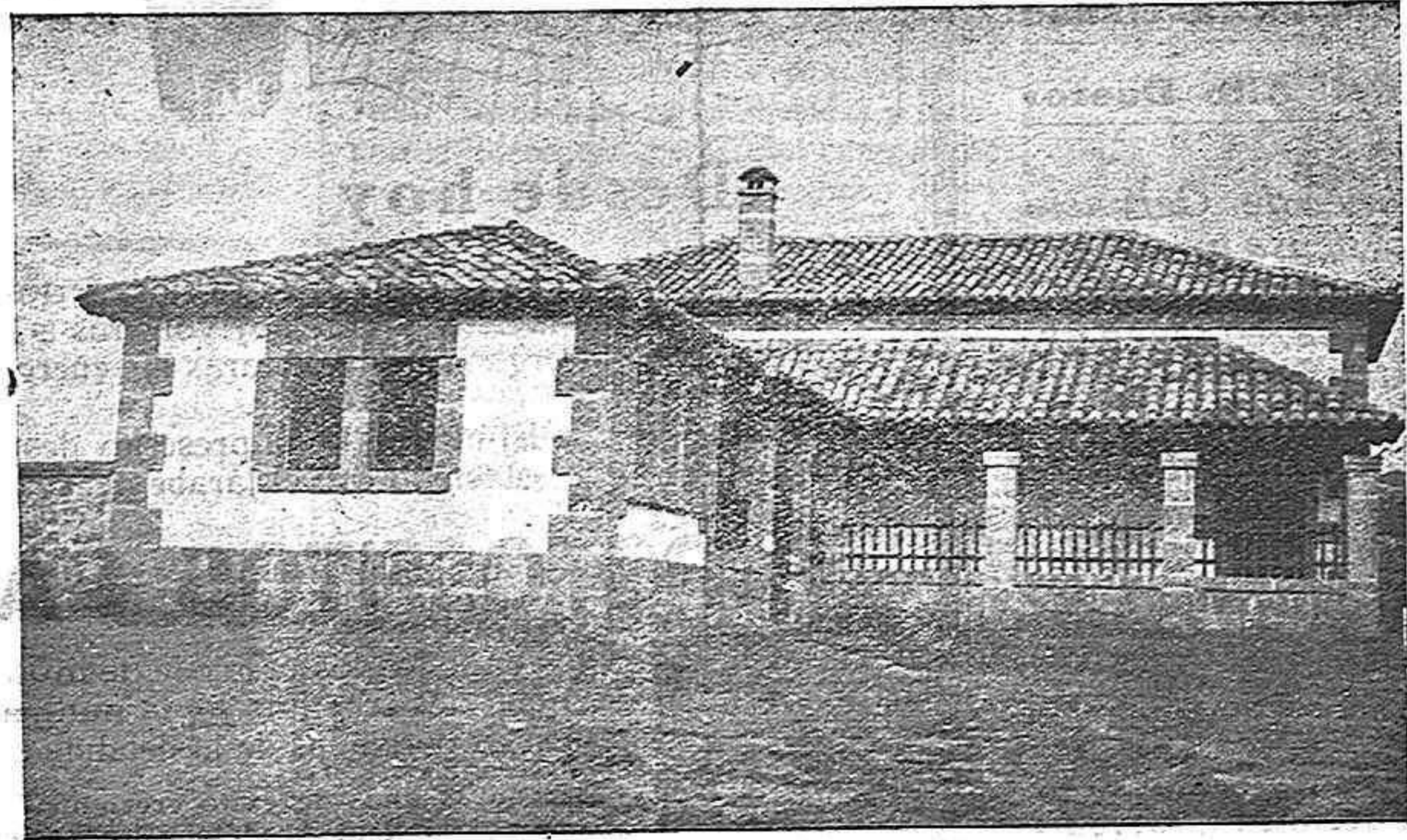
Una Escuela rural de tierra de Soria.

dades admirables por su industria, cultura y riqueza. Palacios escuelas donde se educa la juventud. Simpáticas instituciones benéficas que deslumbran por su instalación y sostenimiento. Y yo sigo preguntando para para mí. ¿Será cierta esa creencia que tienen los extranjeros, que tienen los mismos españoles del Norte, de que Castilla es incapaz de cultura? ¿De que se opone al progreso? Y miro a la ciudad de Soria donde venimos suplicando desde hace diez años, que se construyan Escuelas y no tuvimos éxito en nuestra empresa. Por que si hemos logrado levantar Escuelas en pueblos y aldeas de Soria, hemos registrado casos heroicos, en esta provincia