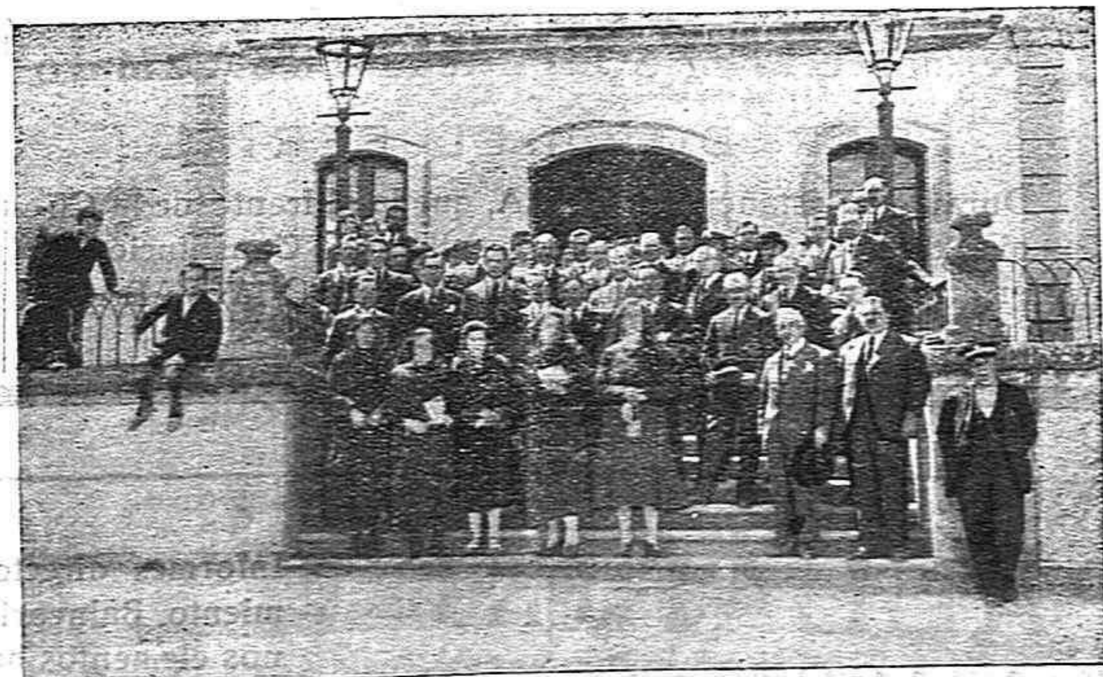
Grupo de autoridades y maestros al salir de la sesión inaugural de la Semana Social.

Última noche en Sevilla. La luna parece tener más brillo en su cara ancha y blanca como una azucena celestial. El río, el Guadalquivir, nos manda el destello negro, como el alabastro, en el que se reflejan las sombras vagas de los que a su orilla nos asomamos. El barrio de Santa Cruz, a la luz de la luna presta el sentimiento mágico de la atracción y el alma siente ganas de soñar mucho, tanto, que tal vez quisiera permanecer eterna en este sueño delicioso. El arte, la emoción, la alegría, el dolor, vida al fin, se unen en este barrio; bello y único, que hay en Sevilla. Periclistas ingleses, americanos, y españoles, vamos comentando la fatigosa jornada de un día e ajetreo y de fiesta. Los cuerpos van cediendo paso al cansancio pero las almas ansiosas aun, quieren permanecer en esta continua emoción y en esta agilidad física que se las depara. Los patios sevillanos a la luz de los farolillos, arte gracioso de la orfebrería española, prestan un singular encanto al cual se une el rayo de luna que ha venido también a presenciar el festín de esta noche tan cristalina, tan