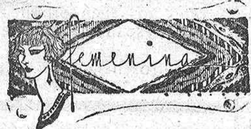
Para la perfecta casada

Si Fray Luis de León escribiera hoy su libro inmortal tendría que añadir inospechados consejos a los sabrosísimos, de entonces.