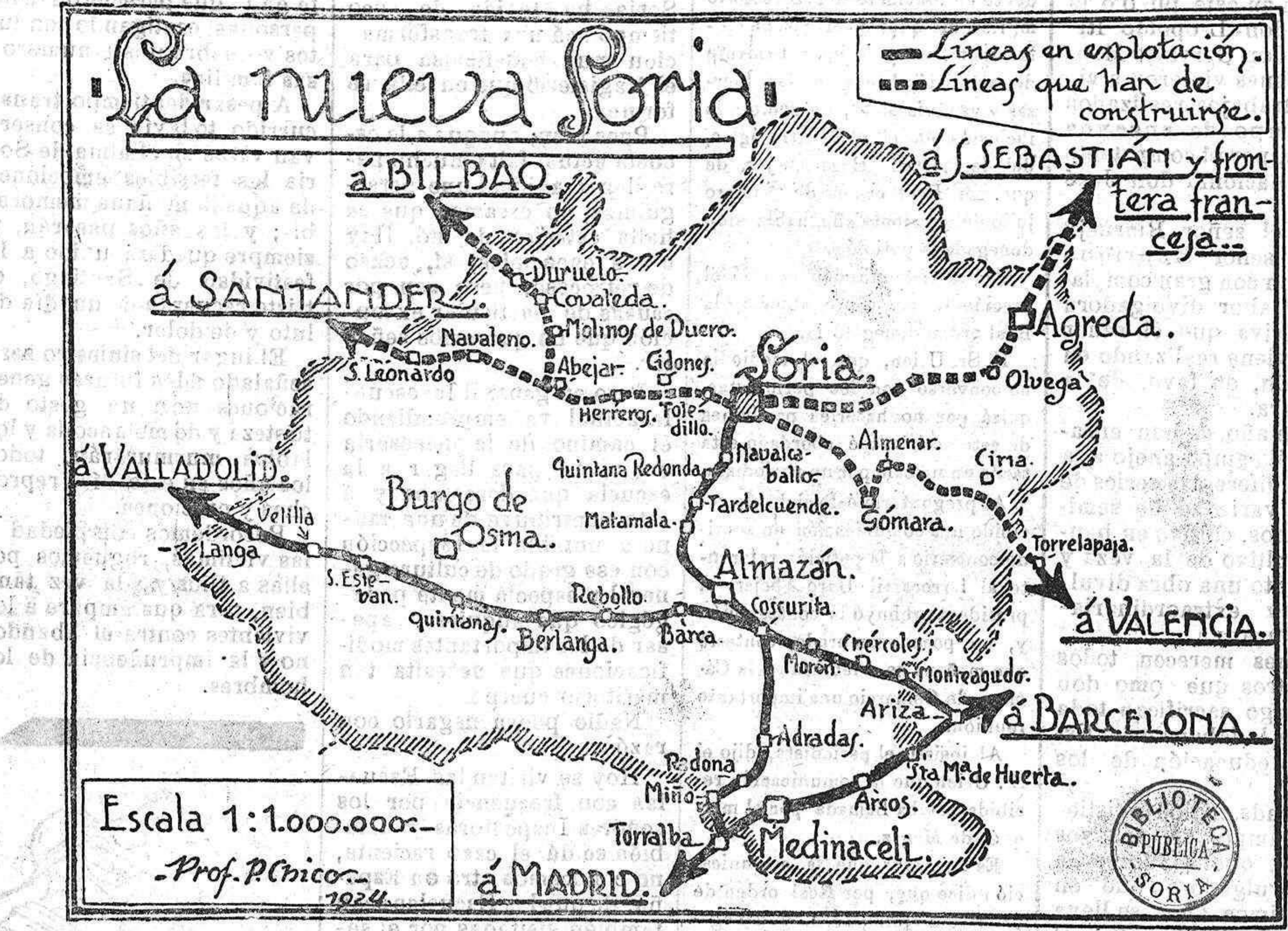
Croquis de la provincia de Soria con el trazado de los ferrocarriles construídos, y con el de los proyectados en vías de realización.

EscULTOR-MARMOLISTA CANDIDO D. APARICIO Talleres: Valverde, 6 Madrid CASA FUNDADA EL AÑO 1886. Especialidad en trabajos para cementerios como lo acreditan los muchos colocados en Soria y sus pueblos. Pidan presupuestos para toda clase de trabajos en mármoles, del país y extranjeros y piedras de granito pulimentado. Fuente de Vicente Alcázar, Sportales del Colledo, 34. Soria.