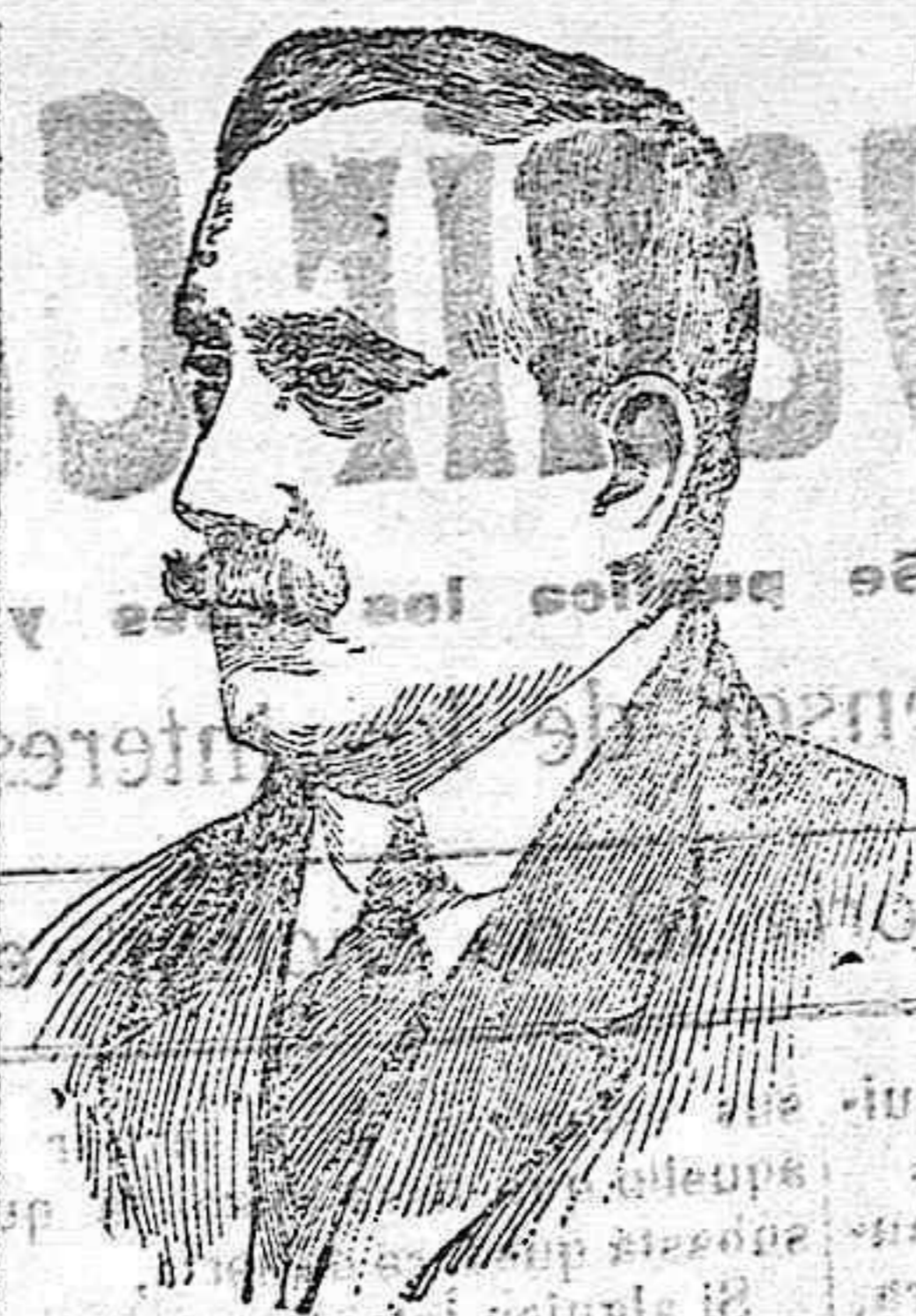
Del ministerio parlamentario.—El ministro de Instrucción Pública D. Natalio Rivas.

Los servicios considerados por nosotros como extraordinarios, que duela cabe de que tenemos perfectísimo derecho á cobrarlos? ¿O es que se pretende continuar con el irritante privilegio en mal hora consentido? ¿De conceder derecho al cliente para disponer de un Médico, en cualquier momento del día ó de la noche, por