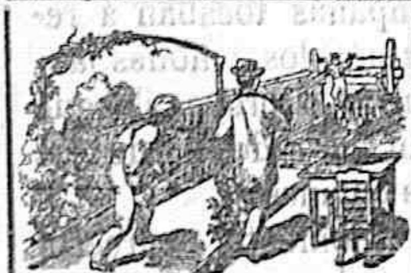
SPORT. Bolos alemanes.

En este establecimiento encontrarán la rica leche de la ganadería de Valdeavellano de Tera.