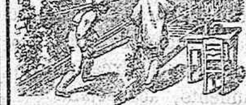
SPORT. Bolos alemanes.