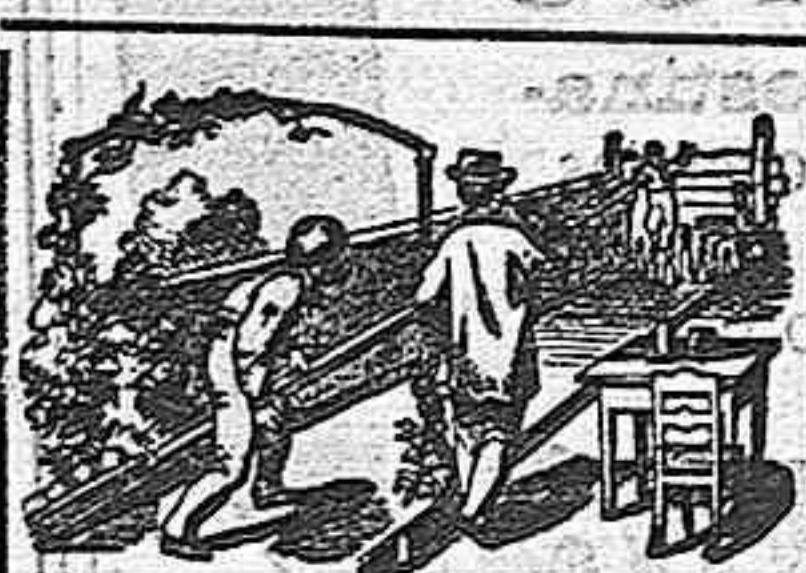
SPORT. Bolos alemanes.

Plaza de Bernardo Robles—(antes Teatinos)—Soria.